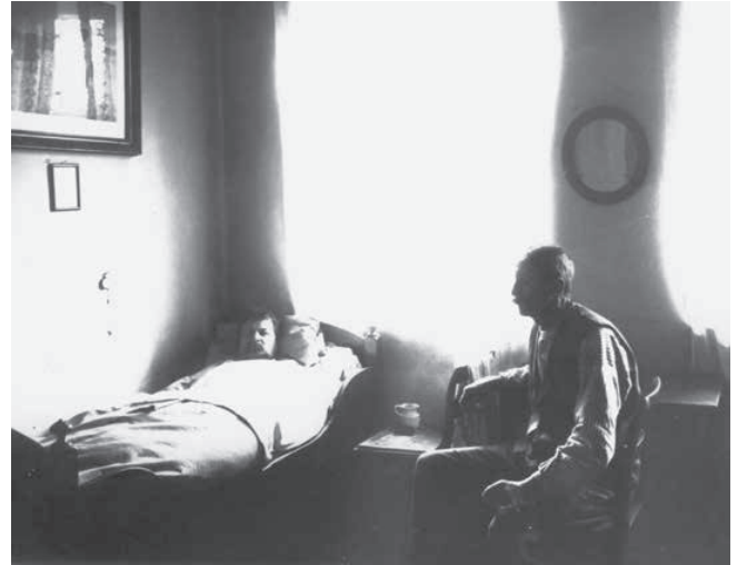
Sygestue for mænd på fattiggården. Cirka 1910.

Der kan spekuleres meget i, hvorfor den ukendte mand eller Koldings Kaspar Hauser forblev ukendt. Måske var han vandret langvejs fra, måske ville de, som kendte ham, ikke have ham tilbage, måske lå der en sygdom bag, måske var han faldet om på en rejse, eller måske var han blevet overfaldet? Spekulationerne er mange, sikkert er det dog, at han ville have været en udgift for, hvem der end modtog ham, og den udgift var fattigvæsenet og kommunerne allerhelst fri for.