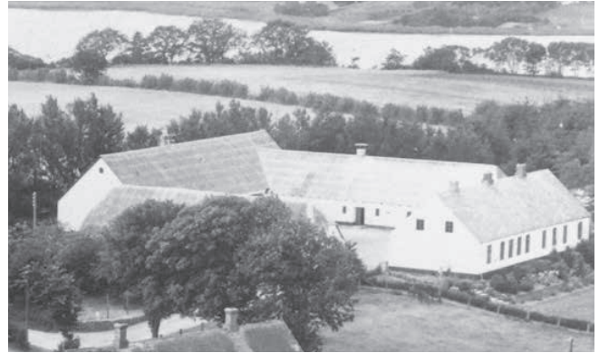
Sandbjerggård, der var fattiggård indtil 1906.