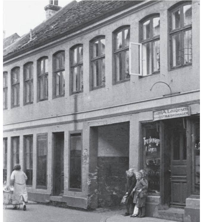
Skarbygård i Klostergade 13. 1935.