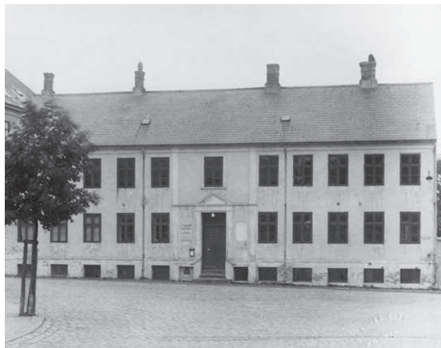
Svietorv. Den gamle fattiggård set fra Katrinegade. 1931.

Politiet forsøgte at efterlyse ham i det internationale efterlysningsblad, Internationales Criminal-Polizeiblatt. Fattigvæsenet forsøgte desuden at få ham til at skrive nogle ord på et stykke papir, som blev sendt til forskellige eksperter, dog uden held. En V. Thomsen fra København udarbejdede nogle skemaer på polsk, tjekkisk, ungarsk og russisk, men også det var uden resultat. Han voldte igennem tiden en del besvær for fattigvæsenet i Kolding. Ifølge en skrivelse var han et "umædgyrligt væsen". 5 Ud fra datidens aviser kunne man dog læse, at fattigvæsenet i Kolding spekulerede i, om manden måske kom fra Kroatien eller Slovenien. Ifølge beskrivelsen fra Internationales Criminal-Polizeiblatt var den ukendte mand "omkring 40 til 45 år, slank eller middel med mørkt hår, magert blegt ansigt, overskæg og halv-