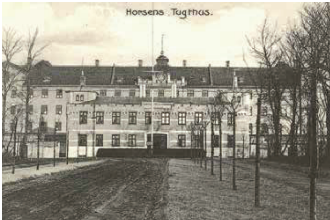
Horsens Tugthus.