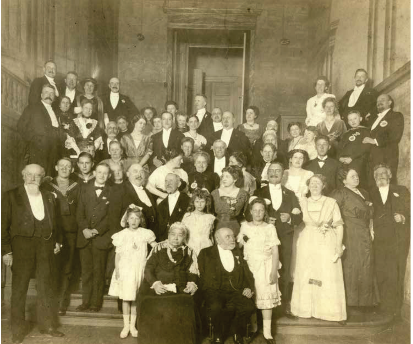
Kolding dramatiske Selskab.