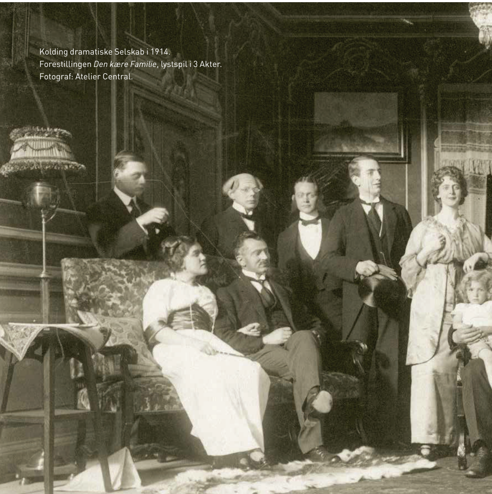
Kolding dramatiske Selskab i 1914. Forestillingen Den kære Familie , lystspil i 3 Akter.