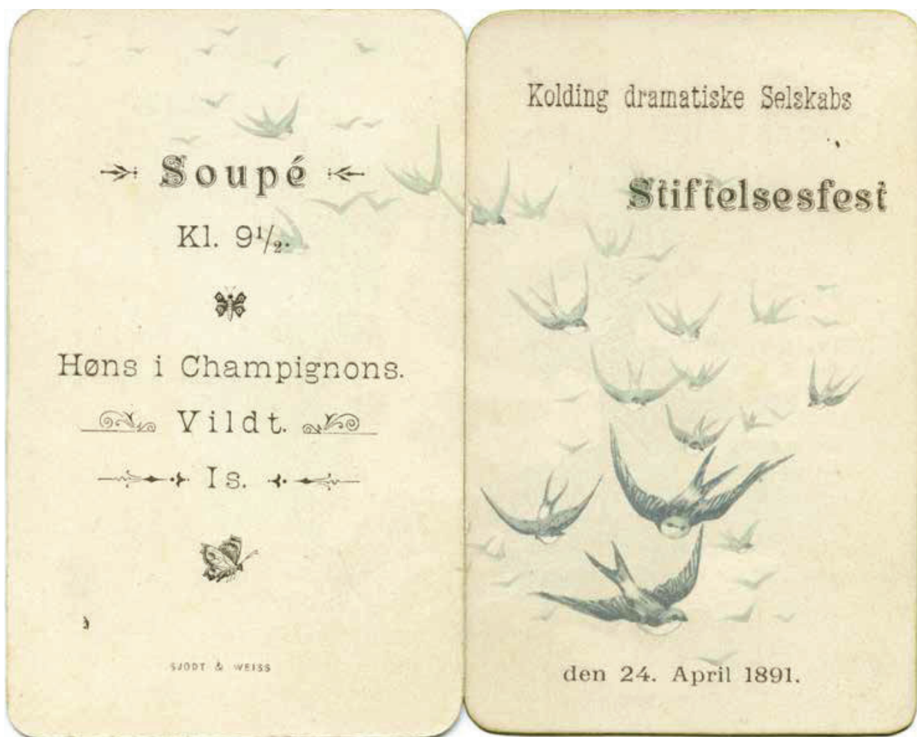
Program til Kolding dramatiske Selskabs Stiftelsesfest.