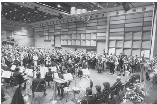
Indvielse af Kolding Teater.

musik og underholdning for hele familien. Da teatret åbnede i 1991 var det med to sale, hvor den store sal kunne rumme mellem 756 til 1200 gæster alt efter opstilling, og den lille amfiscene kunne rumme 146 pladser. Kolding Teater var banebrydende på den måde, at da man byggede sammen med Scanticon, var det et tæt samarbejde mellem det offentlige og det private.