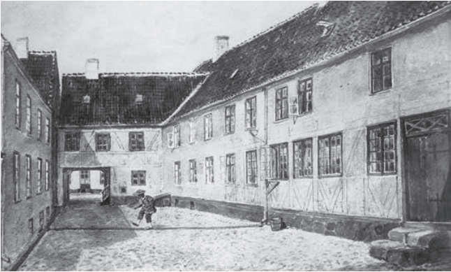
Brandorffs Gård, hvor man gik i teatret. Illustration: Ludvig Thomsen.

stod indenfor døren for at se på den opdækkede sal, hørte han en underlig knagen i bygningen. Han nåede lige akkurat at træde tilbage gennem døren, inden salens loft brasede sammen, og borde, stole og service blev knust og slået itu, alt med undtagelse af én enkelt tallerken. Årsagen skulle findes i, at loftet ovenover salen fungerede som kornmagasin, hvor købmand N.W. Bastrup tilsyneladende må have dynget mere korn op, end loftet kunne holde til. Brandorff fik opført en ny teatersal " Salens længde var omtrent 30 Alen, Bredden 16, Højden 7 ", og der var plads til cirka 350 tilskuere. I loftet over tilskuerækkerne var en stor sukkertønde, som man kunne hejse en lysekrone op i, så lyset blev dæmpet, det er svært at forestille sig, hvordan det må have set ud. Kolding fik endnu engang en ny teatersal efter 1857, da man i klubben Enigheden fik sig en scene, det fortælles, at de købte scenedekorationerne af Brandorff. Denne scene var i brug indtil 1889, da man solgte bygningen, og den del, hvor teatersa-