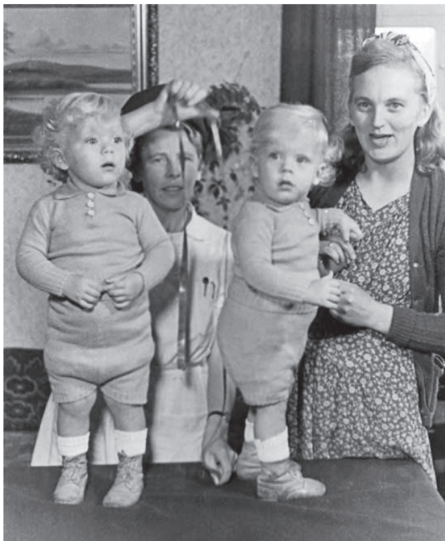
Et tvillingepar der er vokset godt efter at de vejede 1000 g. ved fødselen.