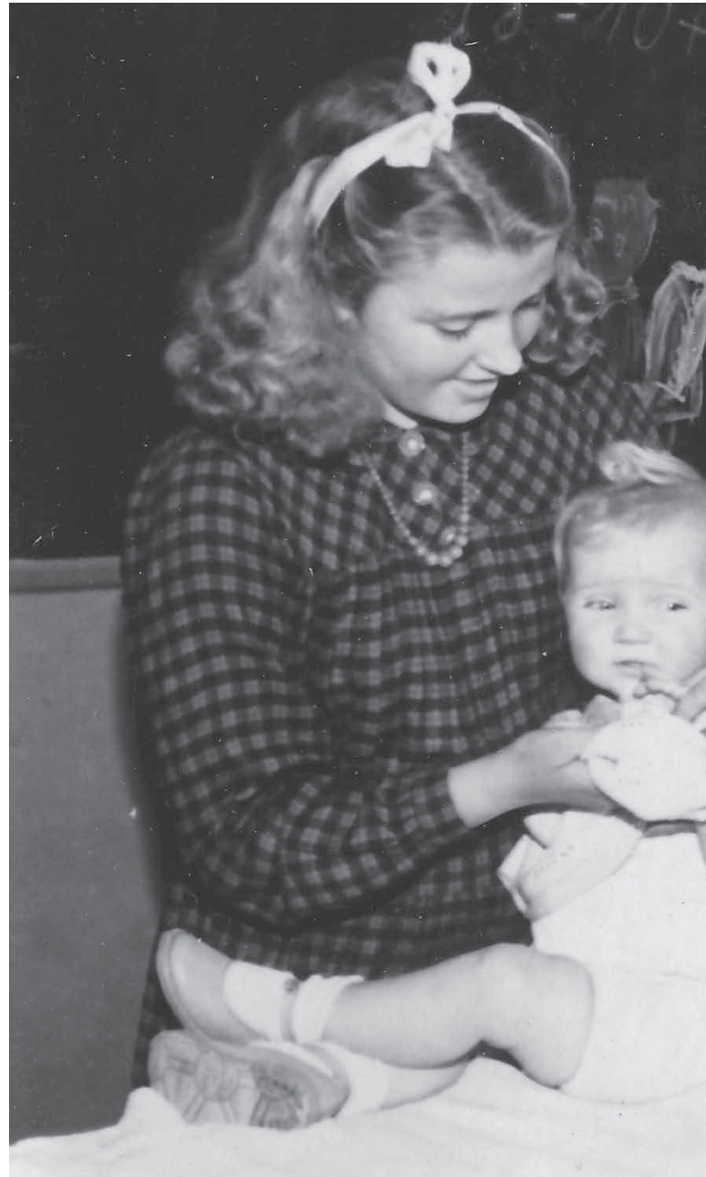
Kursus i barnepleje.