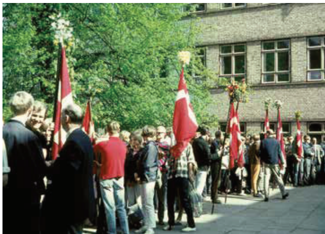
Elever ved Kolding Gymnasium i skolegården på det gamle gymnasium til den sidste majfest i 1966.

søget, og gymnasiet kunne ikke selv finde pengene til det. Det var nemlig amterne, der skulle finansiere forsøget på de enkelte gymnasier, og først når forsøget var gennemført og evalueret, kunne der blive tale om statsfinansiering, og dette mente Vejle Amt ikke, at de kunne bære. 24 Computerne har dog siden gjort deres indtog på gymnasiet.