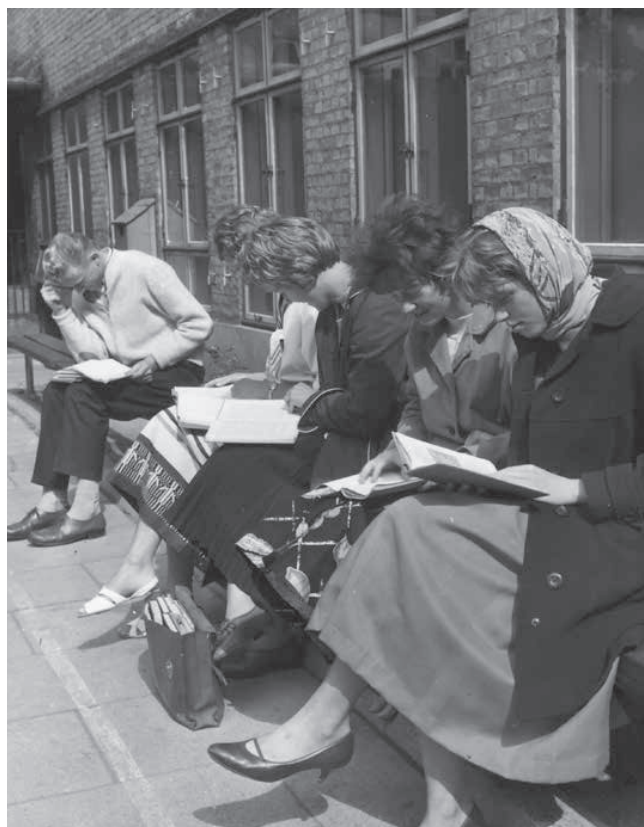
Eksamenslæsning i gården ved Kolding Gymnasium den 18. juni 1959.

1960'erne blev vækstens årti, hvor væksten i befolkningen, økonomien og den private sektor også påvirkede væksten i den offentlige sektor og udbygningen af den danske velfærdsstat, herunder også det offentlige skolevæsen. Visse politiske ændringer havde også indflydelse på denne udvikling. I starten af 1960'erne blev der indført en gymnasiereform – indførelsen af grengymnasiet. Denne skulle også