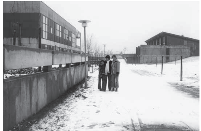
Kolding Amtsgymnasium på Skovvangen i 1977.

Der blev af Kolding Kommune udskrevet en arkitektkonkurrence, hvor vinderprojektet ville blive opført. Konkurrencen blev udskrevet den 24. januar 1970, og den 15. oktober 1970 var vinderne fundet: A5-tegnestue. Byggeriet startede den 1. november 1973, efter kommunen havde sikret sig de rigtige godkendelser, og skitserne var blevet tilrettet. Før udskrivelsen af arkitektkonkurrencen var det allerede aftalt, at skolen skulle ligge i Nørremarksområdet. Nørremarksområdet var på dette tidspunkt ved at blive udbygget med blandt andet Skovparken, der blev opført mellem 1971 og 1973, og det nye sygehus, der var under opbygning. I juni-august 1975 kunne Kolding Gymnasium så flytte ind i de nye lokaler på Skovvangen. 18