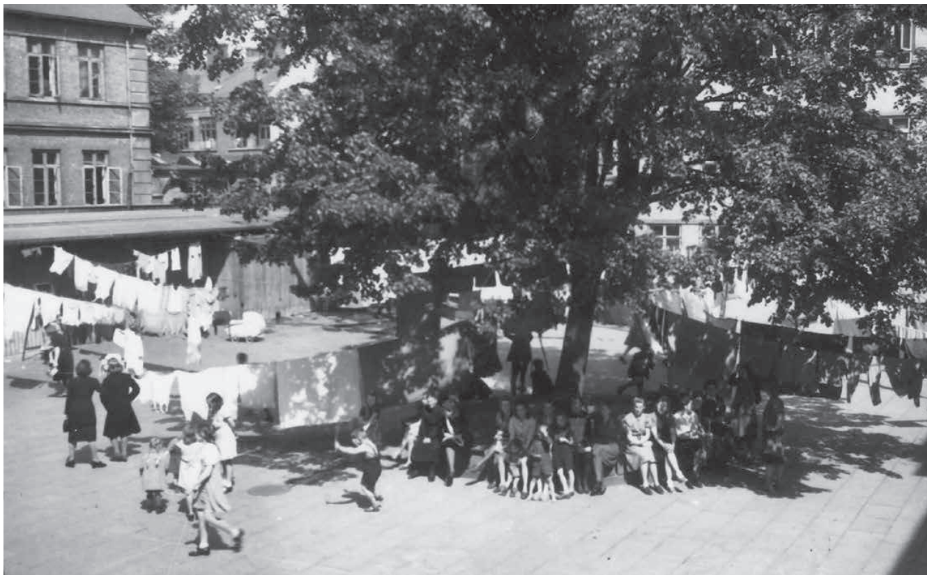
Tyske flygtninge i Almenskolen's gård omkring 1944.

var den nye pædagogiske linje lagt, og det lå også i tiden efter dem, at der var en ny pædagogisk tilgang på vej i alle skoler.