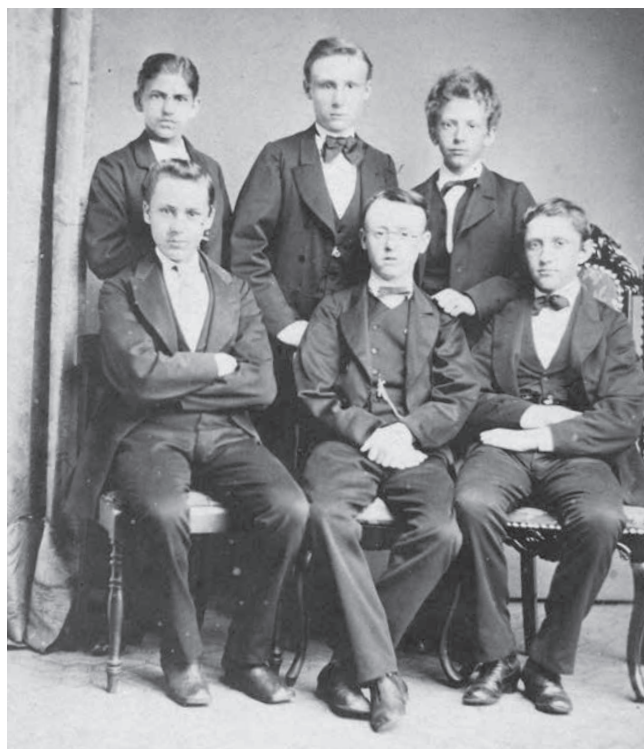
Elever fra Vejle Amts højere Realskole i Kolding 1872.

Kolding Latin- og Realskole var Danmarks første kommunale gymnasium og var således også kommunalt finansieret. Skolen overtog bygningerne fra Vejle Amts højere Realskole i Kolding sammen med en del af lærerpersonalet. Kolding By finansierede kun skolen delvist, og det viste sig hurtigt, at de tilskud, som skolen modtog, ikke var nok. Allerede det første år var der underskud. 3 Skolens øvrige udgifter skulle dækkes via skolepenge. I 1890'erne var der stor diskussion omkring skolens fremtid i aviserne, og der var nok nogen, der ville ønske, at amtet havde beholdt skolen. Dette var en stor forskel fra den by, der i 1855 havde kæmpet for at beholde latinskolen og endda havde tilbudt økonomisk støtte, byen der mellem 1855 og 1880 havde klaget over manglen på latinskolen, og som i 1880 havde hilst den velkommen tilbage. 4 For at løse problemet i økonomien kom skolens rektor Sigurd Müller og Georg Bruun frem til, at skolen var nødt til at få flere elever for at