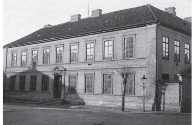
Vejle Amts højere Realskole, senere Kolding Latin- og Realskole. Billedet er fra starten af 1900-tallet.

Latinskolerne, der blev oprettet efter Reformationen, mindede meget om de tidligere katolske skoler. Kirken tilså stadig skolen, og lærerne på skolen var kirkens mænd. Lærer og elever bar sorte kapper, og eleverne blev kaldt disciple. De yngste disciple gik under navnet peblinge, der betyder vordende præster. Ældre disciple hed degne og var, som navnet antyder, kirketjenere. 1 Disse forhold ophørte først i 1800-tallet, hvor nye pædagogiske tanker ændrede den måde, som både skole og elever blev set på.