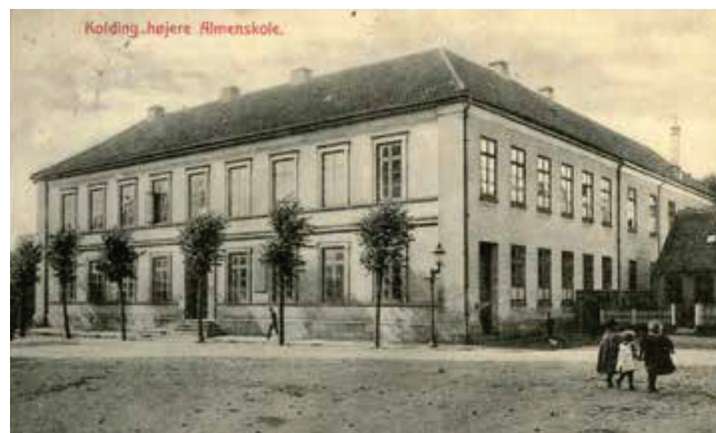
Kolding Højere Almenskole taget omkring 1900-1902. Skolen havde til huse her indtil 1915.

Skoleformen blev ændret i 1903 efter ”Lov om Højere Almenskoler” . Den opdelte de højere uddannelsesanstalter i henholdsvis en fireårig mellemskole, en etårig realklasse og et treårigt gymnasium med tre linjer: Klassisk sproglig, matematisk-naturvidenskabelig og nysproglig. Realskolens afgangseksamen gav adgang til erhvervslivet eller kunne tjene