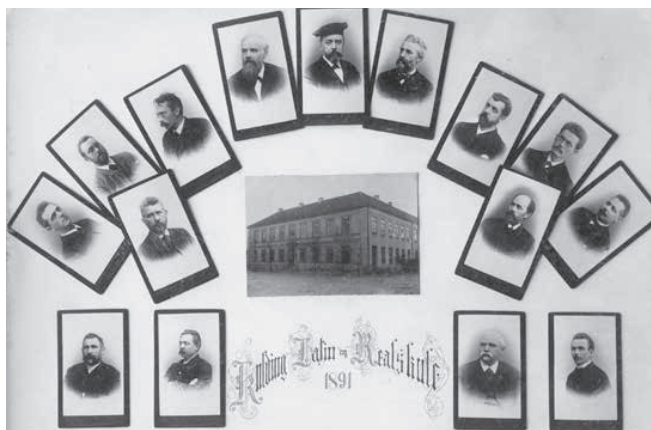
Lærerne på Kolding Latin- og Realskole i 1891.