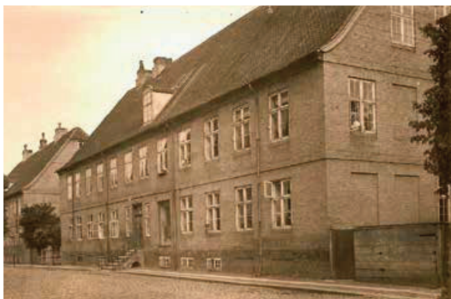
Søstrehuset i Nørregade.

Menigheden var inddelt i de såkaldte kor. Hvert enkelt medlem tilhørte et bestemt kor ud fra alder, køn og ægteskabelig status. Ugifte søstre og brødre levede hver for sig i store fælles huse, korhusene, mens ægtepar og familier med børn boede i private huse. Denne særlige måde at organisere sig på skabte et hverdagsliv, hvor man arbejdede, boede og spiste sammen – ja, var sammen i størstedelen af døgnets 24 timer. Arbejdsdagen var planlagt fra tidlig morgen til sen aften med produktive gøremål foruden bøn og singstunden. De sidstnævnte var ofte af kortere varighed, før man igen gik i gang med dagens dont. Standure rundt på de forskellige etager hjalp husenes beboere med at holde styr på tiden.