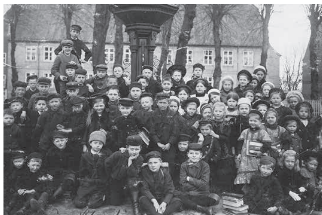
Elever fra Dreng- og pigeskolen på kirkepladsen i 1904. Fotograf: Ukendt.

De mindre byhuse dannede rammen om både produktion og familieliv. Det arbejdsomme samfund oprettede en børnehave, hvor også børn fra mindre-bemidlede hjem havde mulighed for at kunne gå.