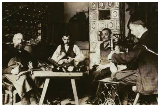
Skomagerværkstedet cirka 1925-30.

Om næringslivet beretter en anden samtidig kilde, Den Danske Atlas fra 1781: "Foruden en del gode håndværkere og butikker findes i byen ulden, linned, bomuld, lakfabrik og sæbeværk, som i kort tid har funden og debit (afsætning) både inden- og udenlands, da fabrikernes boniet er blevet bekendt. Hensigten er at bringe have- og agerdyrkingen i stand efter udenlandske erfaringer, ved flittighed at bringe fabrikkerne og håndværkerne til fuldkommenhed, og derved forskafe næring; forsyne de fattige såvel i byen som i egnen med arbejde, samt ved menighedens