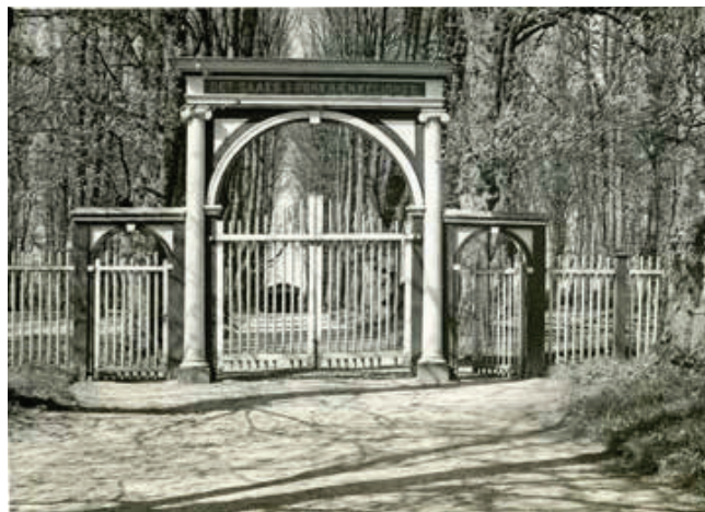
Indgangsportal til Gudsageren. 1921.

Gudsageren afspejlede menighedslivet: De døde blev ikke stedt til hvile i familiegravsteder, men blev opdelt efter køn. Mænd og drengebørn for sig, og kvinder og pigebørn for sig. Hver en inskription