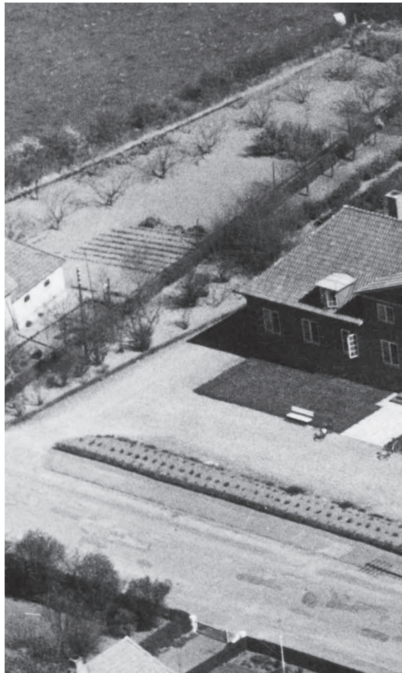
Luftfoto af De gamles Hjem fra omkring 1950.

I løbet af 1930'erne voksede antallet af plejehjem landet over – godt hjulpet af Steinckes socialreform fra 1933. I Hejls betød det, at De gamles Hjem blev opført i 1937. Hjemmet dannede rammen om ældreomsorgen i de næste 41 år. I glimt ser vi tilbage på en række erindringer, hvor plejehjemmet også nåede at skifte navn til Engbo i 1970.