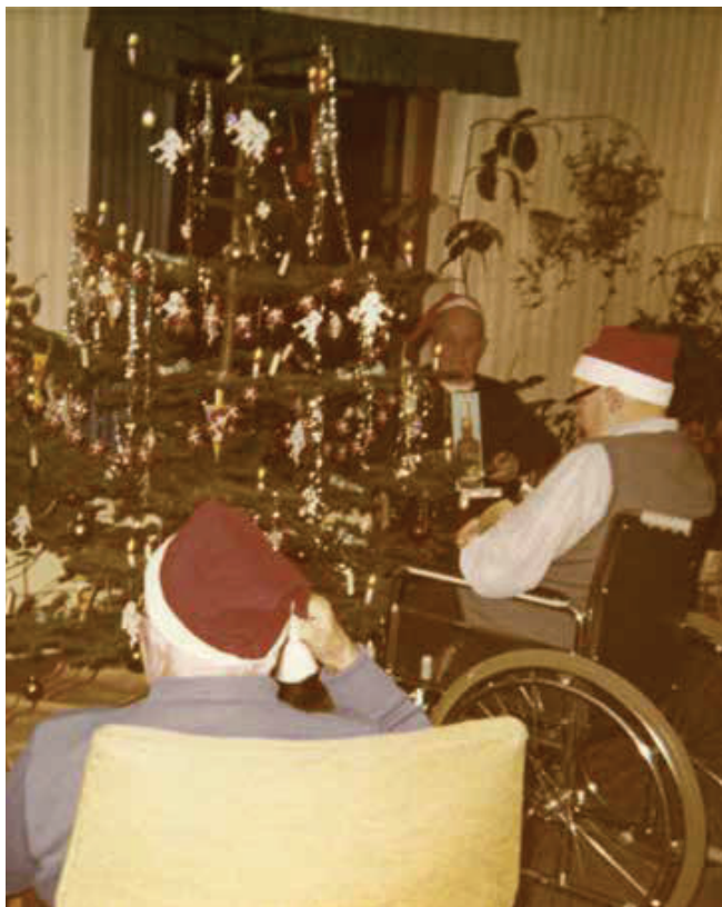
Julen fejres rundt om det smukt pyntede juletræ.