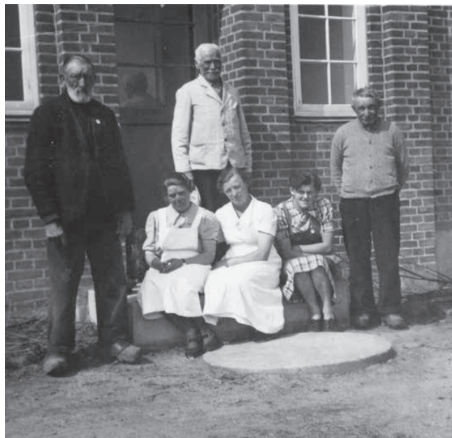
Ansatte og beboere fotograferet ved De gamles Hjem.