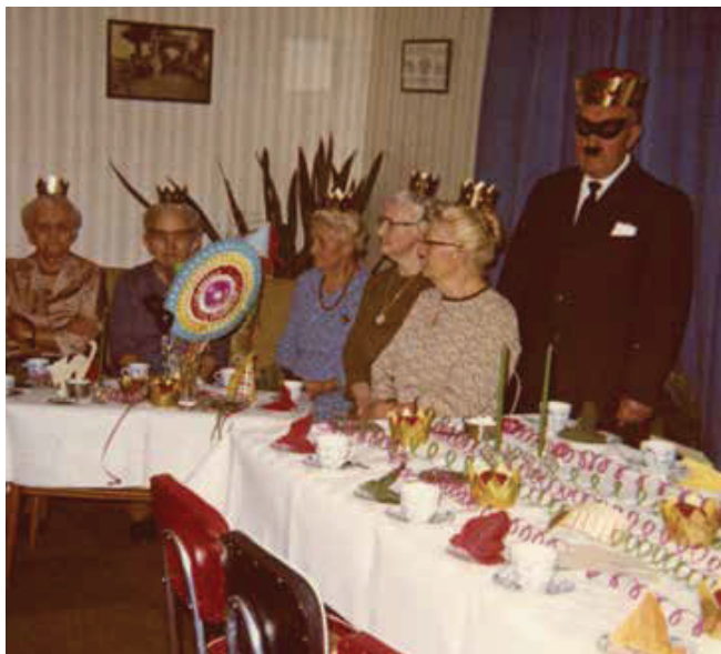
Festlighed på Engbo i 1971.