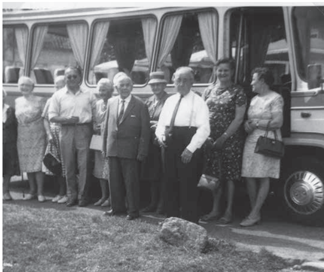
Engbo på bustur i 1970.