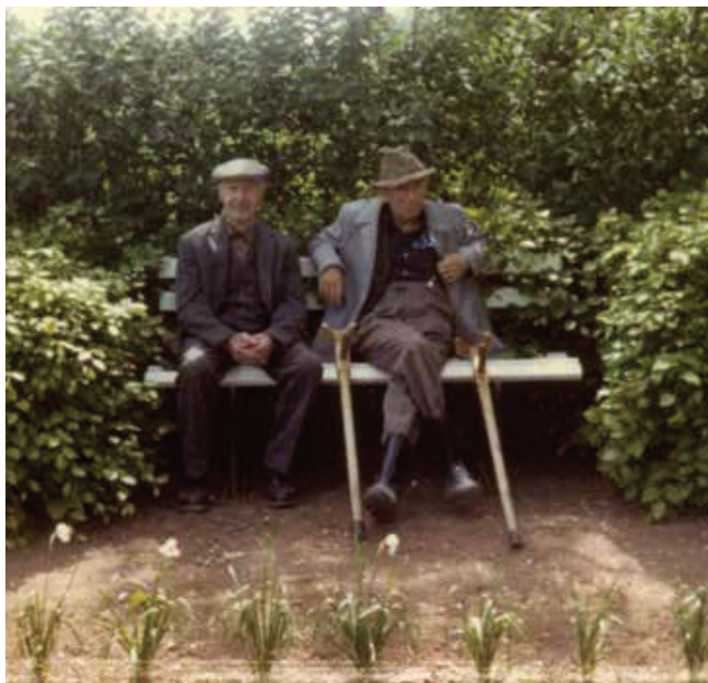
To af Engbos beboere får sig en sludder i haven.

Til afløsning af plejehjemmet besluttede kommunen at lade bygge 14 lette handicapvenlige ældreboliger i det område, der i dag hedder Engløkke lige ved siden af Engbo . Det var Tyrstrup Andelsboligforening, der stod for det nye byggeri, som startede i december 1988 og var færdigt i august 1989. Det kostede cirka 7,3 millioner kroner. Kommunen fik tildelingsretten til boligerne, og det var socialforvaltningen, der stod for udlejningen til ældre og handicappede.