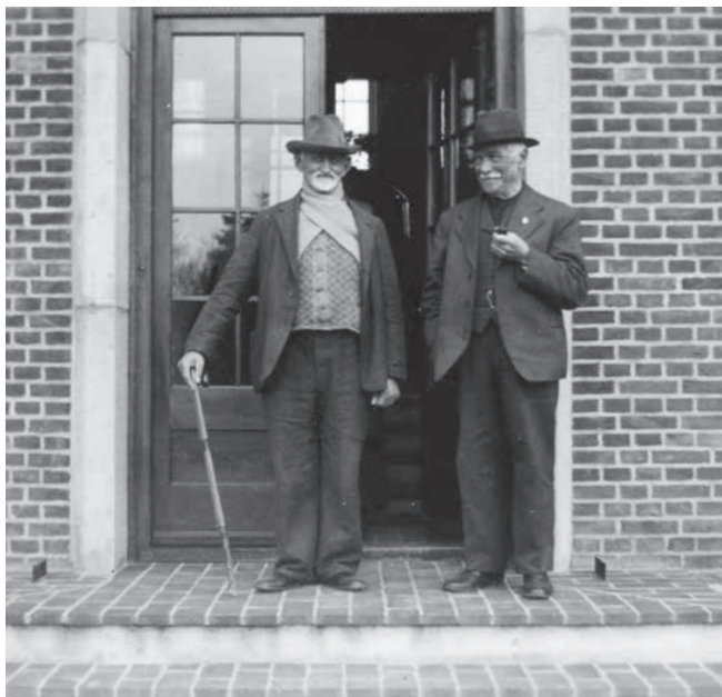
To beboere foran De gamles Hjem.