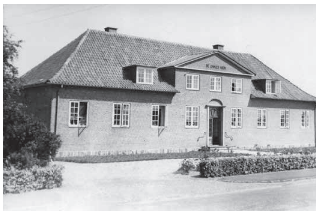
De gamles Hjem.