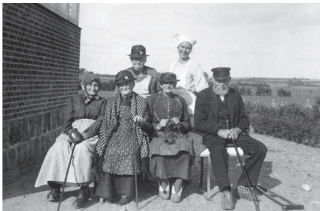
Beboere og ansatte fotograferet ved De gamles Hjem.

Omkostningerne ved byggeri og indretning løb op i cirka 60.000 kr., så arven på de 36.000 kr. var en betragtelig hjælp. Restbeløbet blev skaffet ved lån på kr. 30.000 i kommunekreditforeningen. Alderdomshjemmet var sat i takst således, at det i Hejls måtte koste 2 kr. dagligt pr. person, det vil sige, at hvis der var 10 beboere plus tre medhjælpere i alt 13, måtte man bruge 26 kr. dagligt, der så kom ind under den sociale tilskudsordning. Brugte man mere, måtte kommunen selv klare den ekstraudgift. Man klarede sig med de 2 kr. endda så rigeligt, at man sørgede for nyanskaffelser, så der regnskabsmæssigt aldrig blev overskud.