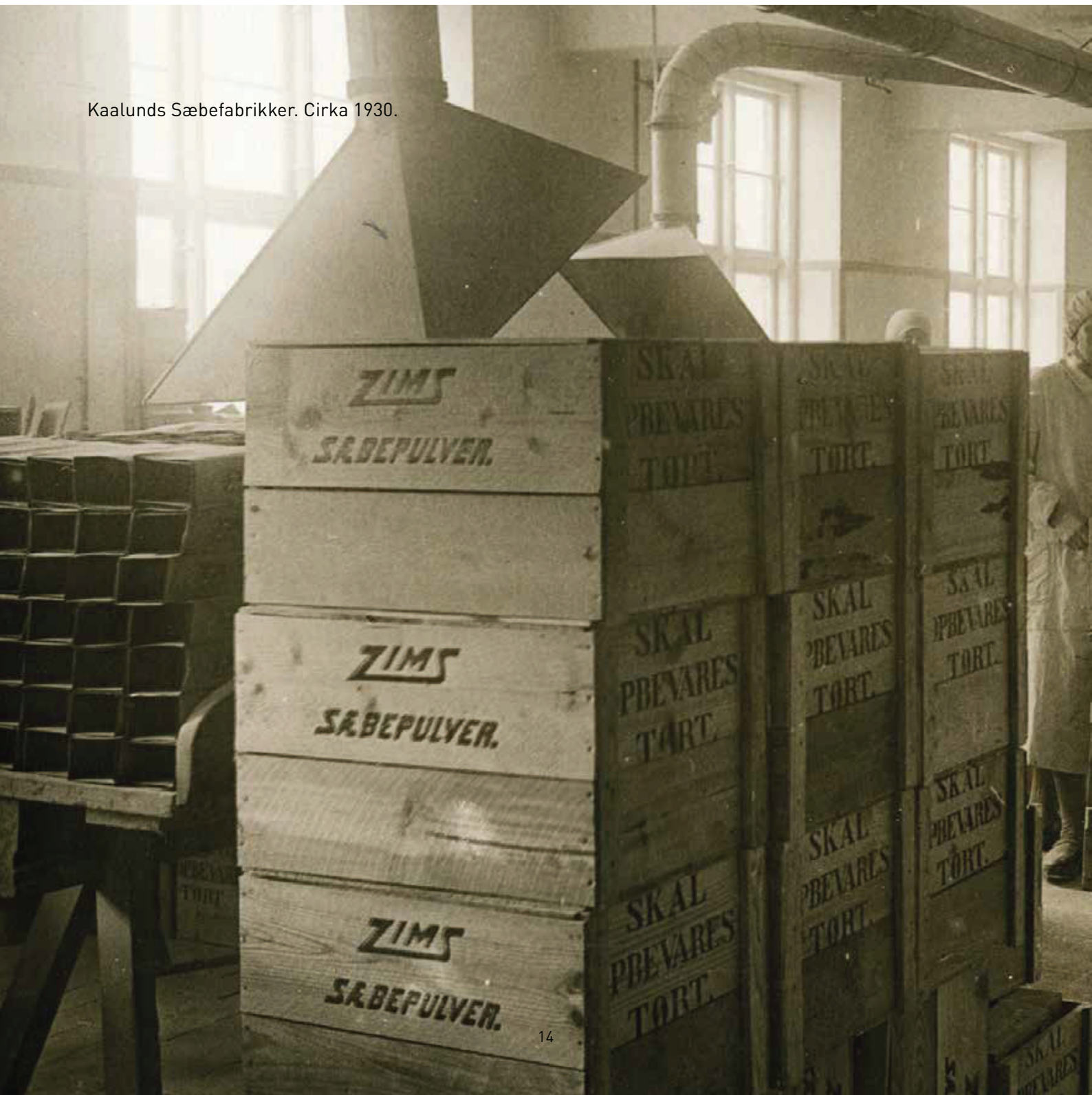
Kaalunds Sæbefabrikker. Cirka 1930.