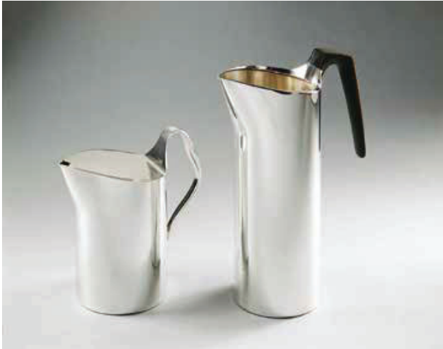
Vandkande med låg og martinikande, henholdsvis fra 1954 og 1960. Karl Gustav Hansen, når han er enklest.

sølv skal pudses. Sølvets rolle som prestigegenstand i hjemmene blev efter Anden Verdenskrig overtaget af husholdningsmaskiner, biler, sommerhuse, lystbåde og udenlandsrejser.