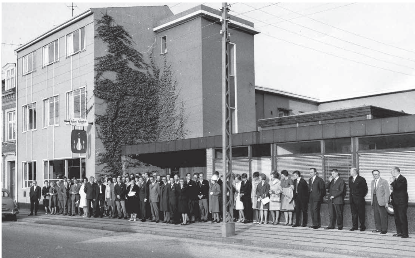
Mazantigade 2. Hele personalet opstillet foran fabriken i anledning af firmaets 50 års jubilæum i 1966.