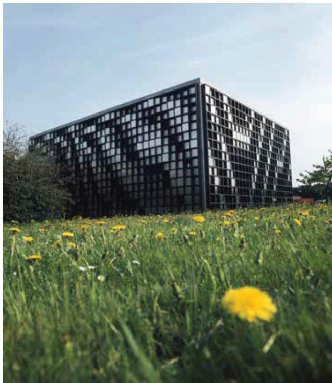
Væveributikken på Sdr. Ringvej/Dieselvej i 1993.