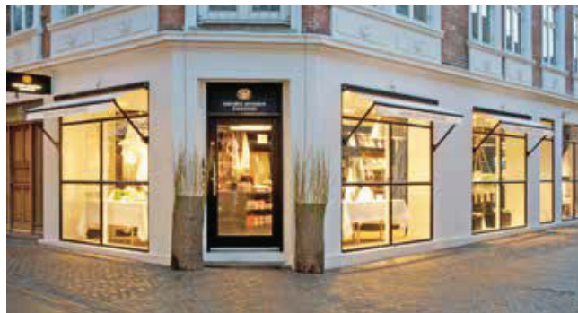
Butikken i Ålborg.