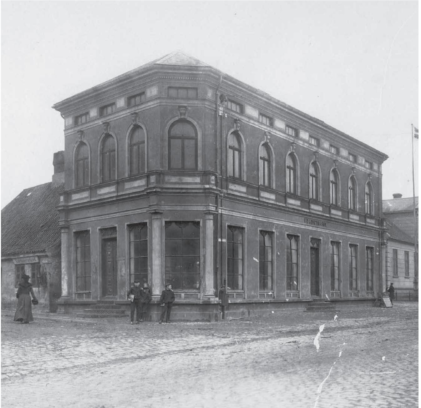
En tur rundt i Koldings tidlige industrikvarter