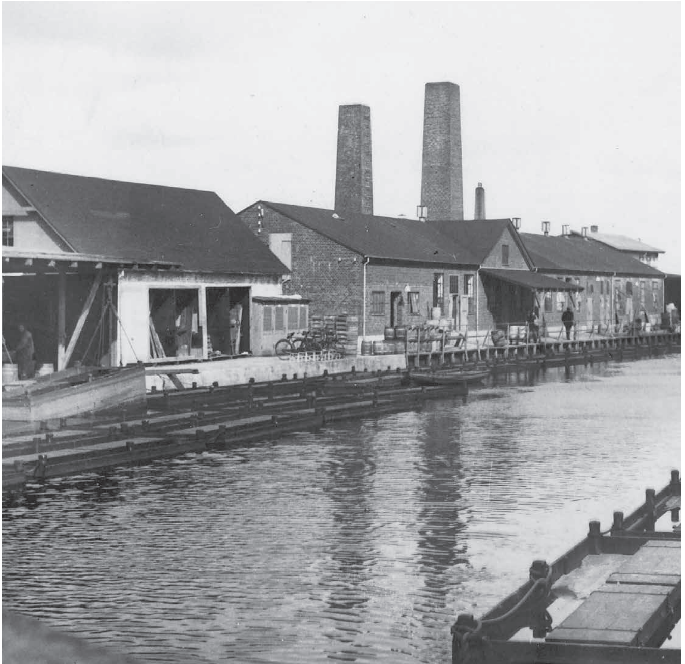
En tur rundt i Koldings tidlige industrikvarter