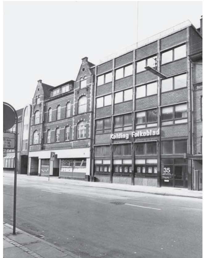
Kolding Folkeblad i 1989.

De, der arbejdede som trykkere, blev efterhånden alle sammen døve. En trykker, som stod ved en almindelig maskine, som ikke larmede så meget, blev ikke udsat for de samme skader, men når han så maskintrykte, så kom han ind i den store larm, og det var hver eneste dag, der gik med det. Der findes også et gammelt udtryk, som man vedholder den dag i dag, at så var man 'rotationstrykker'. I dag kan man lave rigtig store aviser, hele magasiner, med fantastiske tillæg med rejser. Det kunne vi ikke nå dengang, hvor vi trykte fra dag til dag i bly, da meget af det, vi lavede i hånden, skulle lægges af igen. Når vi havde fag for fag i håndsatsbaren, og det var sat sammen til hele linjer, og vi havde fået en form ud af det, trykt og det hele, så skulle det hele lægges af igen, for ellers var der ikke bogstaver nok til det næste, vi skulle lave. Sådan en proces blev kaldt aflægning, og det blev gjort med vand på, fordi så skiltes det bedre ad. Aflægning var ikke nogen langsomme-