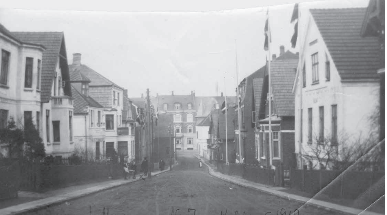
Kolliinsgade set mod Haderslevvej i 1917.