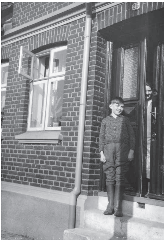
Her står jeg på trappen til vores hus - og mor står bag døren og ler.