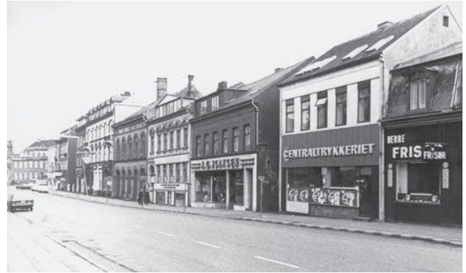
Centraltrykkeriet i Jernbanegade i 1974.

Den nok mest kendte og omtalte arbejdskamp fandt sted i 1981 med en stor typograf-lockout. Typografer bladverdenen over havde i et stykke tid aktioneret i kampen om at sætte sig på den nye elektroniske teknik, som ville betyde et farvel til blyet. Da Dansk Arbejdsgiverforenings tålmodighed var brugt op, fik de hjælp af LO, som også var trætte af de strejkende typografer. Derfor udtænkte de en plan, som ville få typograferne ud på glatis, når de forestående overenskomstforhandlinger skulle finde sted i 1981. Mæglingsforslaget vidste de på forhånd, at typograferne ville takke nej til, og derved blev typograferne