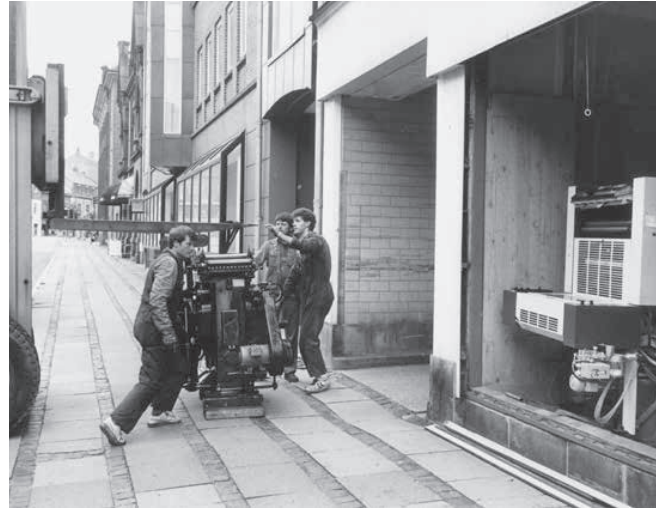
De gamle maskiner skiftes ud på Kolding Folkeblad i 1988.

I bogtrykkeriet lavede vi alt muligt andet ud over at trykke aviser, vi havde også tryksager til bøger, og jeg lavede faktisk også chokoladeæsker til Saxildhus i alle mulige farver. Der skete faktisk engang en sjov ting for en trykker, som ikke lige var dygtig nok. Han kom til at lave en dum fejl, som alle kunne have lavet. Manden er død for længst, så vi må gerne snakke om ham. Han kørte et oplag igennem med gul farve. Det