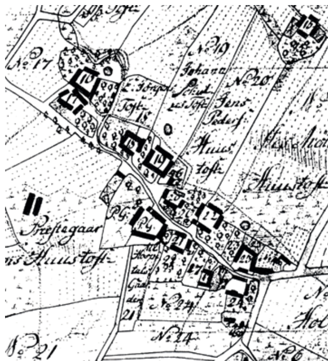
Udsnit af udskiftningskort over Hejls fra 1787.