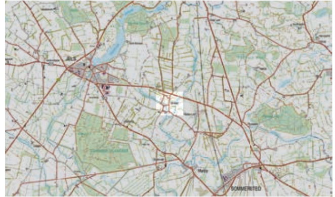
Ørsted i dag.