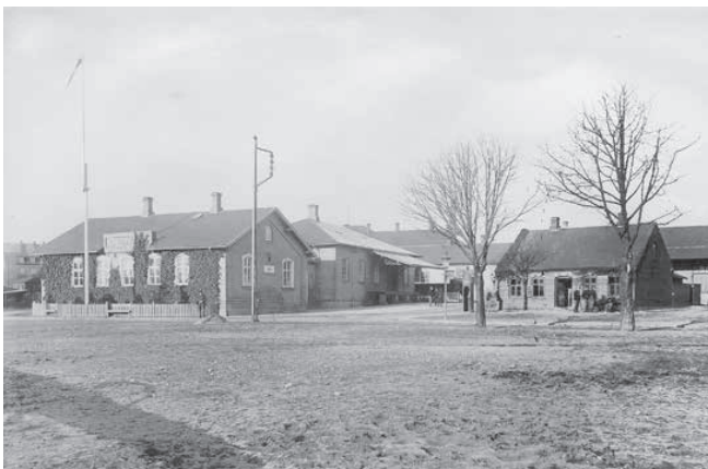
Ved udbruddet af Første Verdenskrig blev 50.000 mand af sikringsstyrken indkaldt. Her ses toldboden og hovedvagten for sikringsstyrken i Kolding 1916.