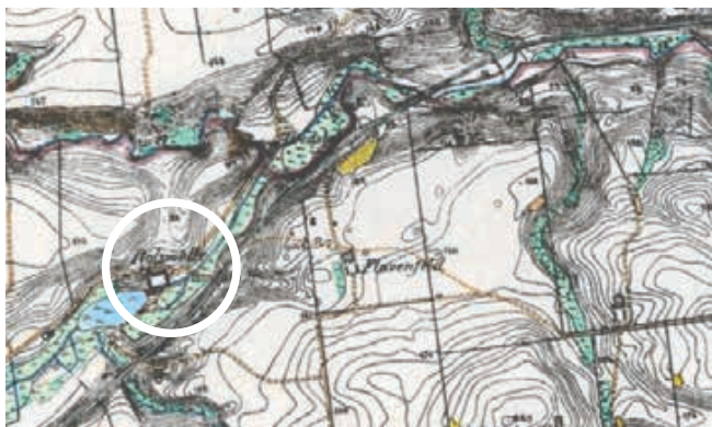
Henrettelsen fandt sted på en statsejet grund ved Rols mølle på Hvolbøl Mark i Lejrskov Sogn.