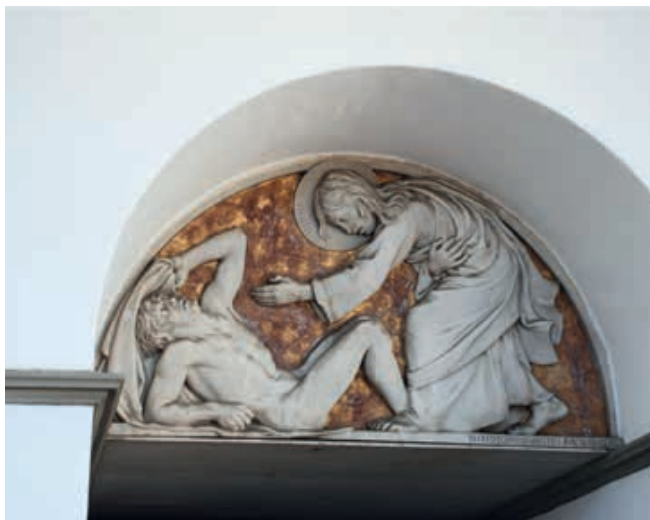
Lazarus' opvækkelse. Bestilt i forbindelse med Kristkirkens opførelse og indsat i 1925 over Kristkirkens hovedindgang ud til Haderslevvej. Skænket af