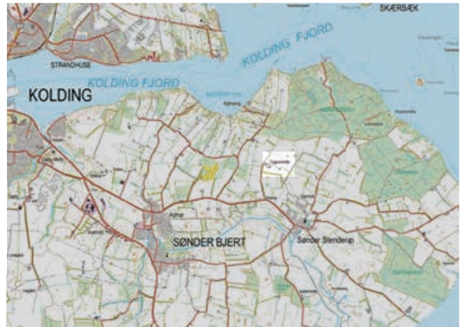
Nyt kort. Kort & Matrikelstyrelsen.

tilbragte de dog ofte somrene på Thygesminde eller i et lejet hus i Strandhuse.