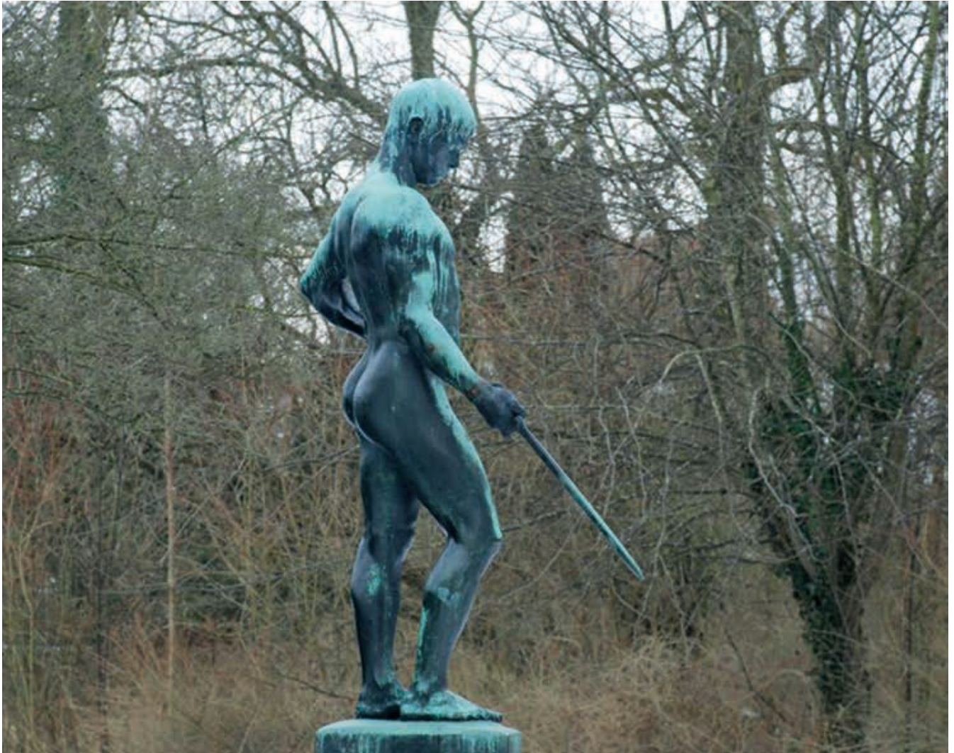
Skulpturen Uffe kom til Kolding i 1947.