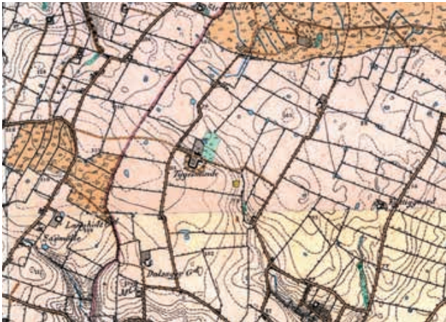
Gården Thygesminde. Lave målebordsblade 1901-1971.