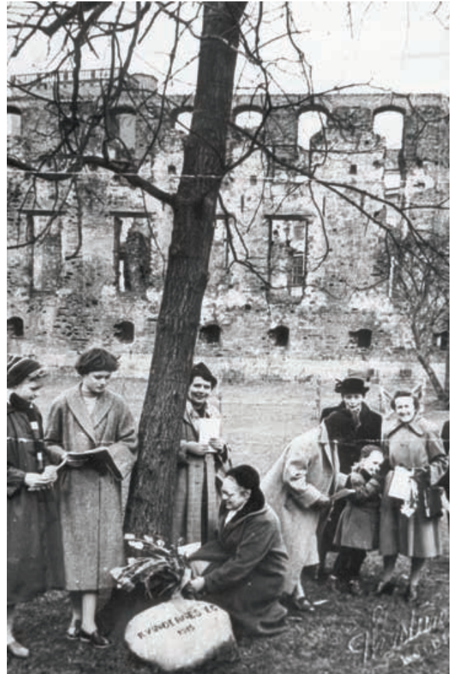
Dansk Kvindesamfund på besøg ved Kvindernes Eg ved Koldinghus omkring 1950.

Derudover var hun en kvinde, der ville og kunne selv. Det viste sig især i hendes målrettethed i sin kunst, men også i hendes privatliv. Hun var som kvinde, mor og kunstner på mange måder kompromisløs. Hun var kompromisløs i sin formgivning og brugte megen tid på at få den givne model rigtig. Dette gik til tider ud over familien; blandt andet da den hest