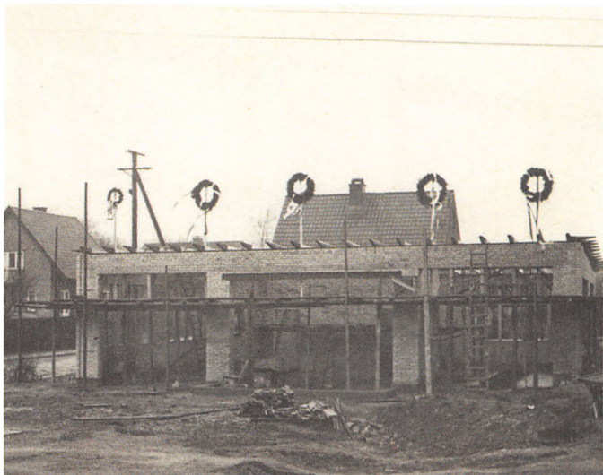
Shell-stationen bygges i 1958 på hjørnet af Ivar Dahlsvej og Storegade i Lunderskov.