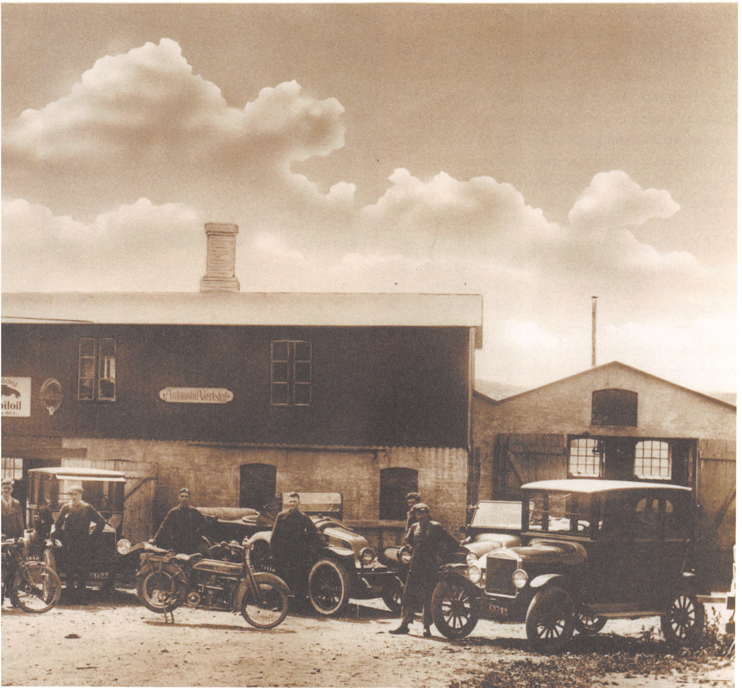
'Værnemagerens' søn og modstandsmandens datter