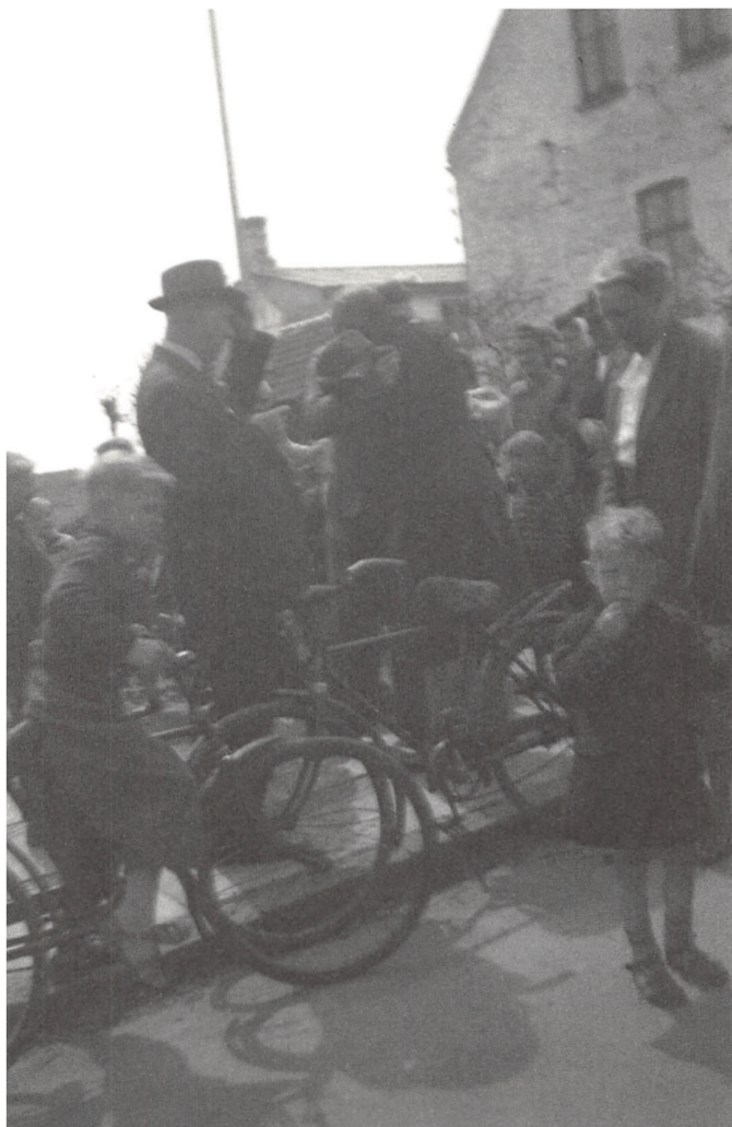
Et rørende gensyn med ægtefælle og børn, som ikke vidste, om han var i live.