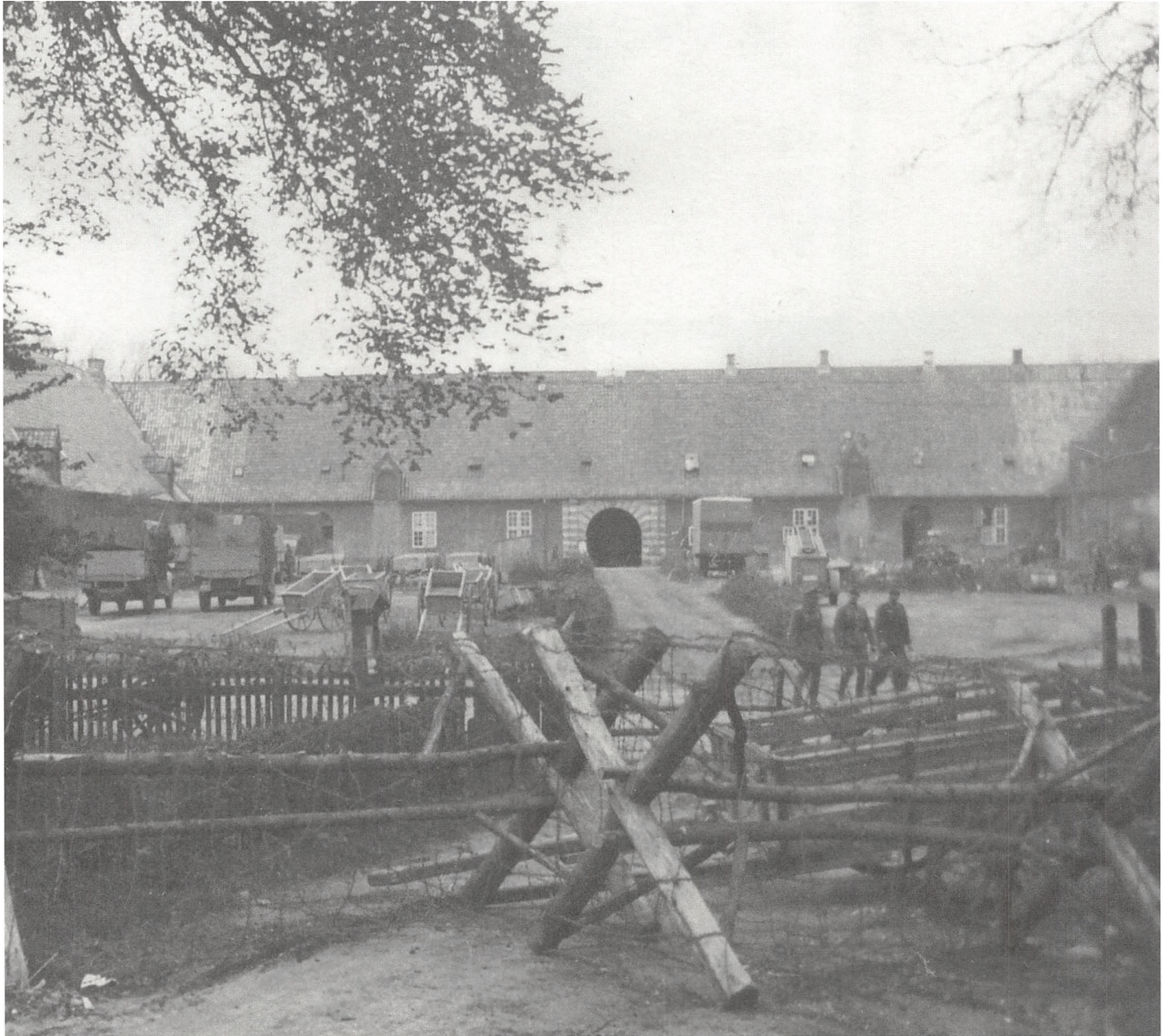
Gestapos hovedkvarter på Staldgården, hvor tortur og forhør af de danske modstandsfolk fandt sted.