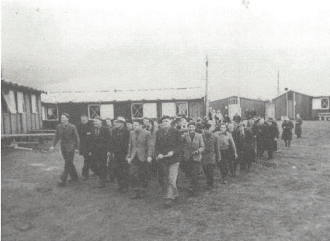
Danske og norske fanger føres i 1945 ud af en kz-lejr til De Hvide Busser for at blive transporteret til Sverige.

Tyskland, som mente, at mange ville dø, inden de allierede nåede frem. Det var derfor nødvendigt at iværksætte en redningsaktion med mulig hjælp fra Sverige, som havde forholdt sig neutralt under hele krigen, og som derfor kunne være en god mægler. Lederen af SS, Heinrich Himmler, der var hovedansvarlig for de tyske koncentrationslejre, havde efterhånden indset, at Tyskland ville tabe krigen, og han så også det neutrale Sverige som en god mægler for de tyske forslag i forbindelse med de kommende fredsforhandlinger. Den norske eksilregering kunne derfor også godt se fordelene i, at Sverige blev inddraget i redningsaktionen, og de gav derfor den norske ambassade i Stockholm tilladelse til at få svenskerne med på idéen. Den svenske udenrigsminister var positiv overfor forslaget, og han sendte derfor den næstkommanderende for det svenske Røde