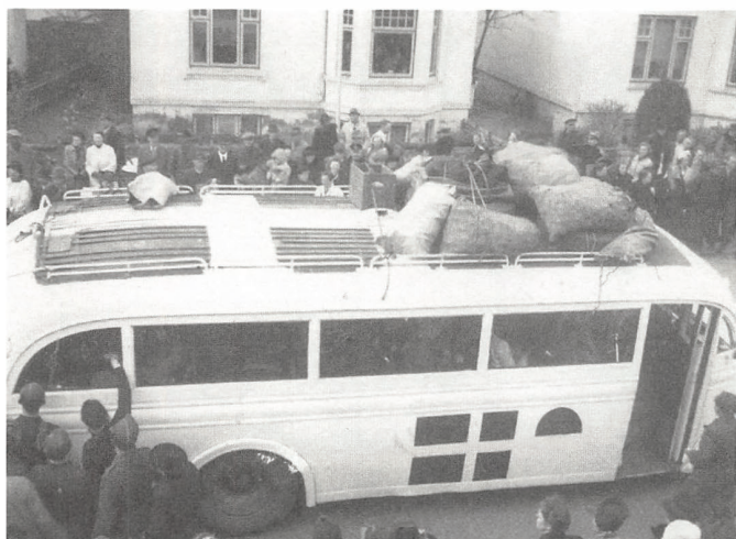
De Hvide Busser fra Danmark var malet hvide med Dannebrog for ikke at blive beskudt fra luften.

også et betydeligt antal allierede krigsfanger, og det blev nu Hjælpekontorets opgave at sørge for forplejningen af disse mennesker og sørge for, at de havde et sted at være. Til dette formål fik Røde Kors derfor stillet nogle tidligere tyske barakker samt Badmintonhallen på Østerbrogade til rådighed. I begyndelsen var førsteprioriteten at sørge for disse mennesker, og først efterhånden blev det muligt at sortere dem efter nationalitet, hvorefter man løbende kunne sende dem hjem til deres respektive hjemlande.