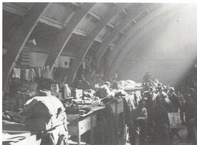
Badmintonhallen var blevet opført i 1937, men i 1945 blev den brugt til at huse flygtninge, som manglede et sted at være efter krigen.

En stor del af arbejdet var at få fangerne og flygtningene til atter at vænne sig til en normal tilværelse. Mange af de mennesker, som blev indkvarteret i Røde Kors-lejrene, var tidligere indsatte i tyske fangeleje eller tyske flygtninge, som var på flugt fra det tyske sammenbrud.