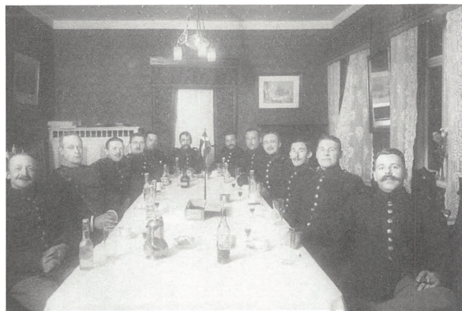
En del af sikringsstyrkens Kolding-kontingent poserer - tilsyneladende i kammeratligt lag - for fotografen.

"I min erindring fra de første måneder af krigen staar