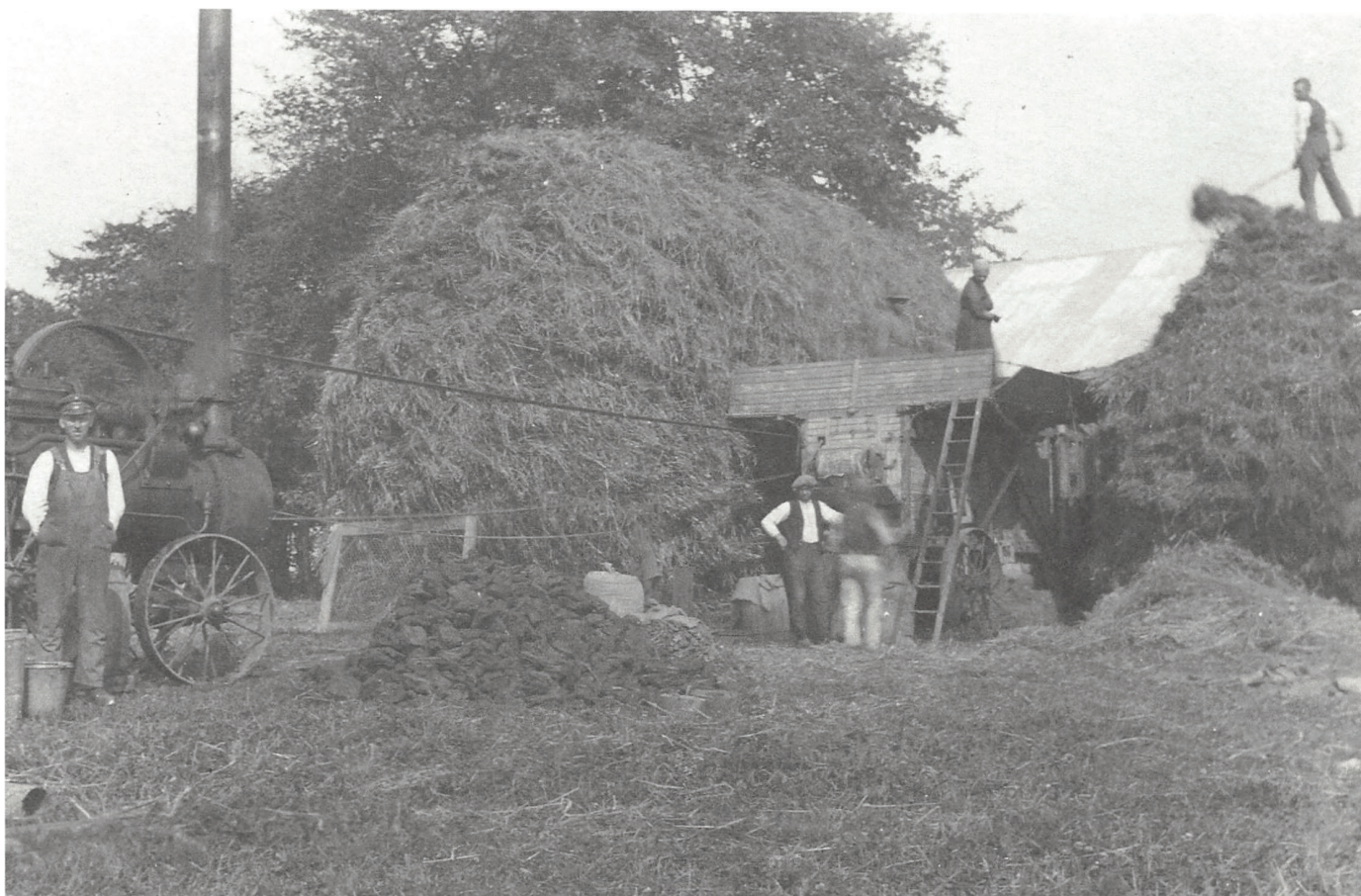
Der høstes på en gård - så vidt vides ikke proprietær Thomsens - ved Nørre Bramdrup cirka 1915.