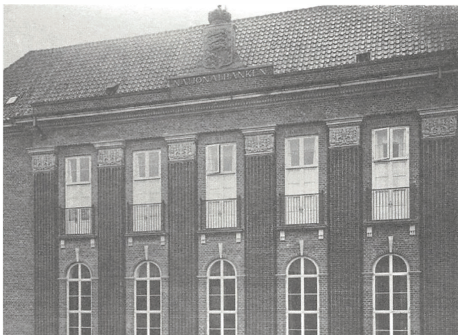
Nationalbankens Kolding-filial fotograferet i 1920'erne.