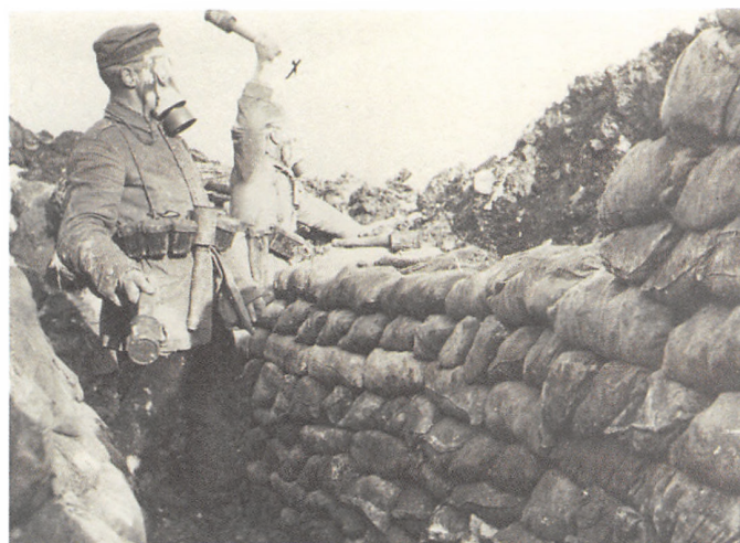
Et typisk billede fra skyttegravskrigen.

Det at overkomme og erindre Første Verdenskrig satte sig dybe spor i eftertiden. Det kan eksempelvis ses i forestillingen om den såkaldt tabte generation, født omkring år 1900, der krydsede skillelinjen mellem barn og voksen i krigens skygge, og hvis verden aldrig blev den samme igen. Slet ikke da det gik op