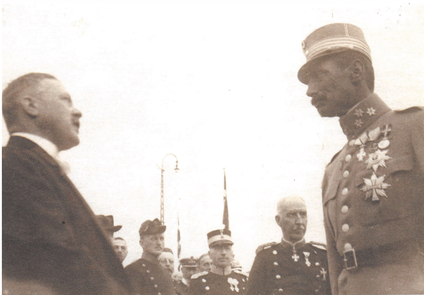
Oluf Bech tager imod Christian X, da Kongen ankommer til Kolding den 10. juli 1920.