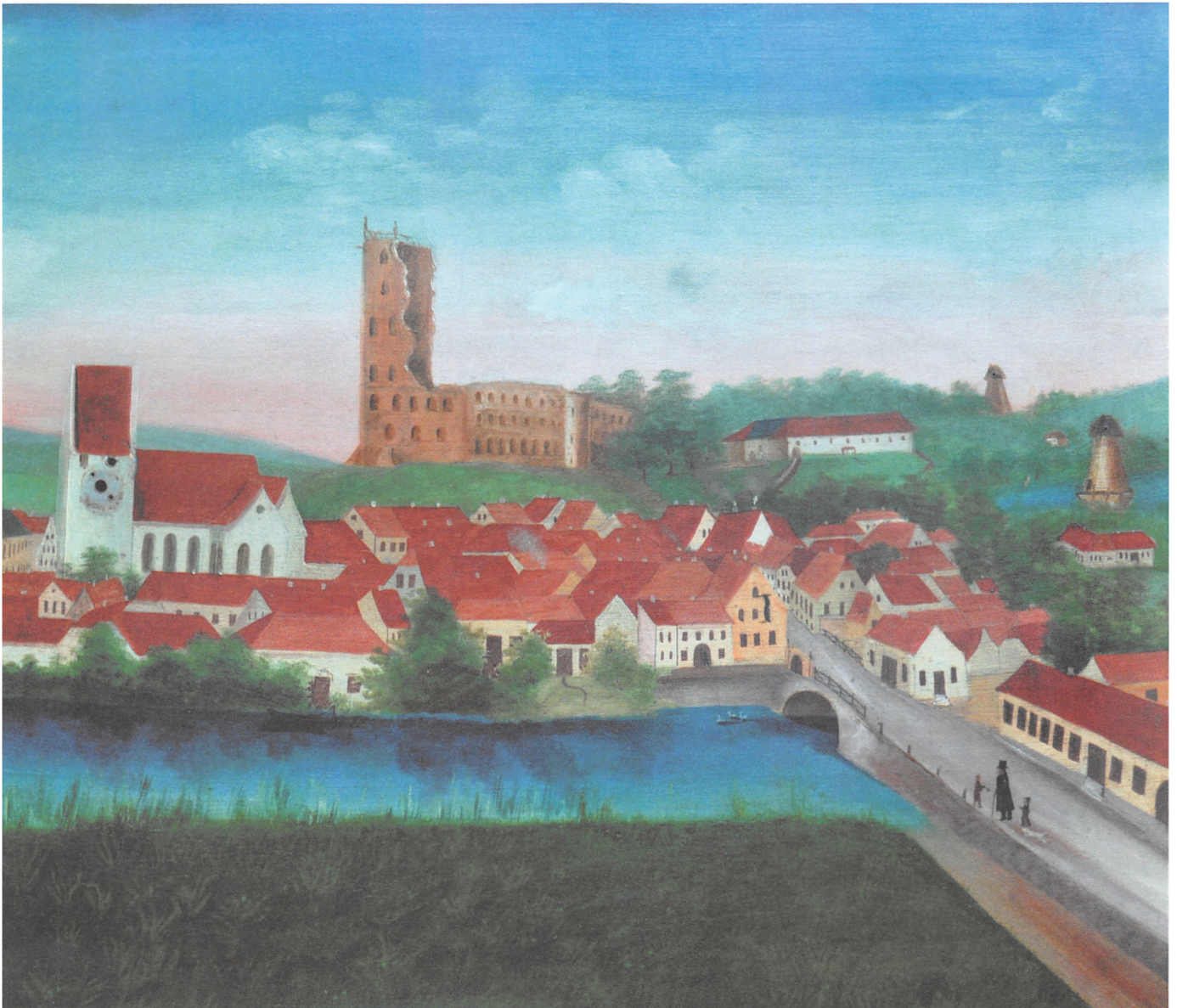
Kolding set fra syd cirka 1847. Affotograferet maleri, hvor urviserne på kirken oprindeligt kunne bevæges

ligesom vingerne på møllen. Originalen hos Finn Erwald.