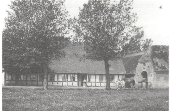
Viuf Kro var centralt placeret i Vejle Amts 2. valgkreds, som var identisk med Kolding. Mange politiske møder blev holdt her, mens valgene fandt sted i selve Kolding.