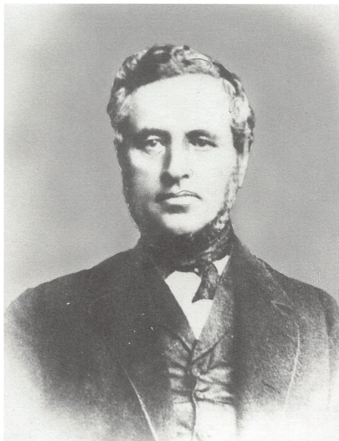
Mathias Warming har lagt navn til Warmingsgade i Kolding.