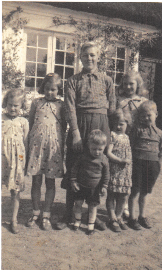
Søskendeflokken på syv, som var så hårdt ramt af skarlagensfeberen, foran den gamle kro i Gl. Aalbo. For en gangs skyld var søskendeflokken ikke fotograferet på en række efter alder, 1937.