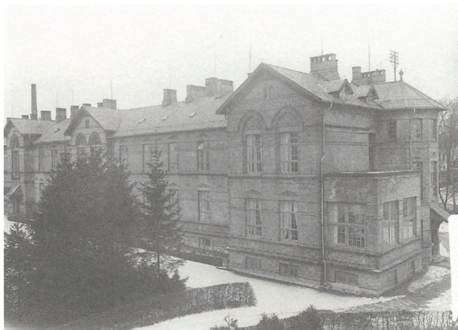
Kolding Sygehus.

længere var smittet med skarlagensfeber. Så da han var udskrevet fra Epidemien , blev han hurtigt indlagt på Sct. Hedvigs Klinik, som var en klinik grundlagt i 1921 af Sct. Hedvig Søstrene. Deres speciale var blandt andet øjen- og ørelidelser, og i 1929 havde de fået opført en ny stor bygning med plads til 65 patienter.