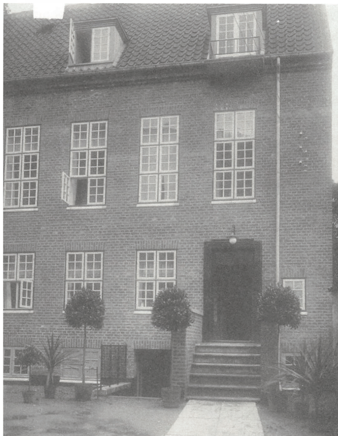
Kvindernes Bygning i Slotsgade 1 blev taget i brug i 1922. Billedet er fra havesiden. Efter 1945 blev bygningen solgt.

æren af at være fanebærer. I slotsgården var rejst en tribune, som de cirka 700 fremmødte, kvinder som mænd, samledes om. I de historiske omgivelser og velsignet med strålende vejr hørte den store forsamling på flere taler. Alle talere gjorde en del ud af at klinke de skår, som kampen om kvindevalgret måtte have forårsaget. Fru pastorinde Mouridsen fra Lejrskov betonedes således, at kvindevalgretten ikke