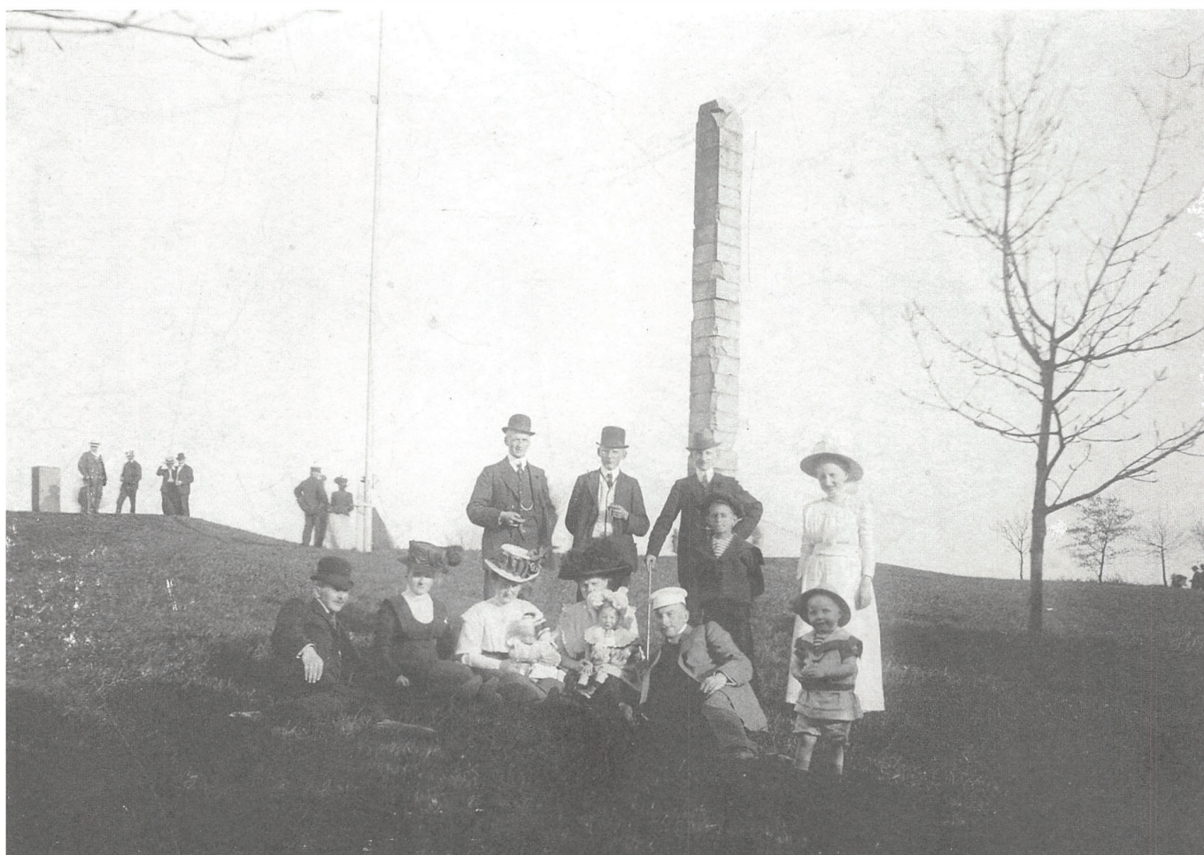
Efter 1864 blev Skamlingsbanken et mindested for det tabte land og et populært udflugtsmål. Billedet af familieudflugten er fra 1909.