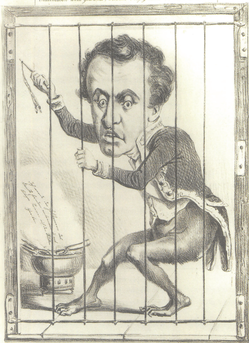
Satyrische Zeitbilder N° 26 Bei B.S. Berendsen in Hamburg. Gegenwärtig Orangen, genannt Orangy Lehman, gemeinlich niederkniefen, wieder gefangen sind. Hölzig. Es ist nicht zu erwarten, dass sie sich nicht durch ihre eigene Unwissenheit in dem Falle befinden werden, als es nicht vor sich geht, — an welche sie sich von ihrer Unwissenheit herablassen.

Jedermann wird gewarnt, diesem Nützigen nicht zu nahe zu treten!