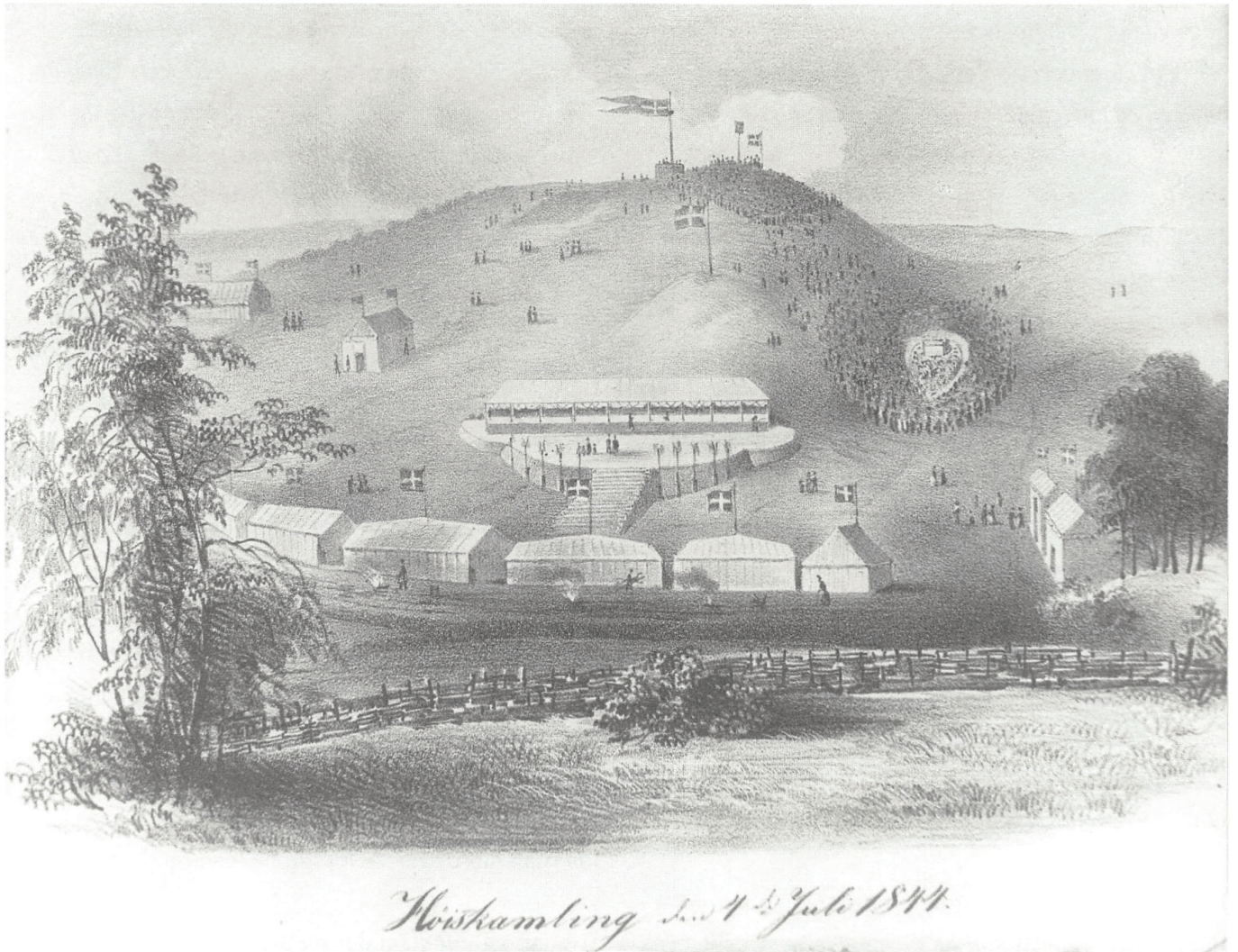
Sprogfesten i 1844 blev et tilløbsstykke med omkring 10.000 deltagere.