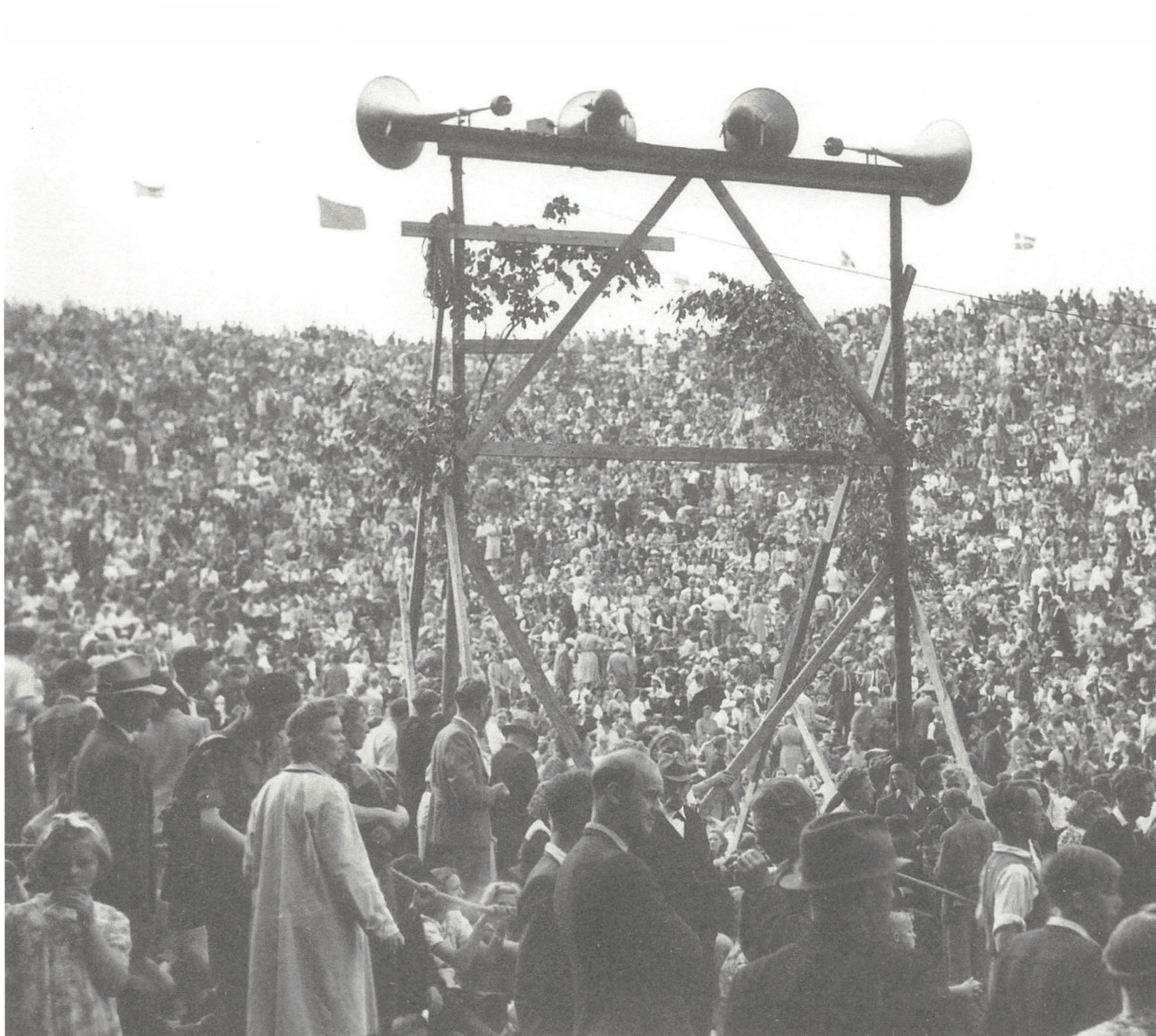
Den største folkefest af alle på Skamlingsbanken fandt sted den 24. juni 1945 i anledning af befrielsen og samlede hen ved 100.000 deltagere.