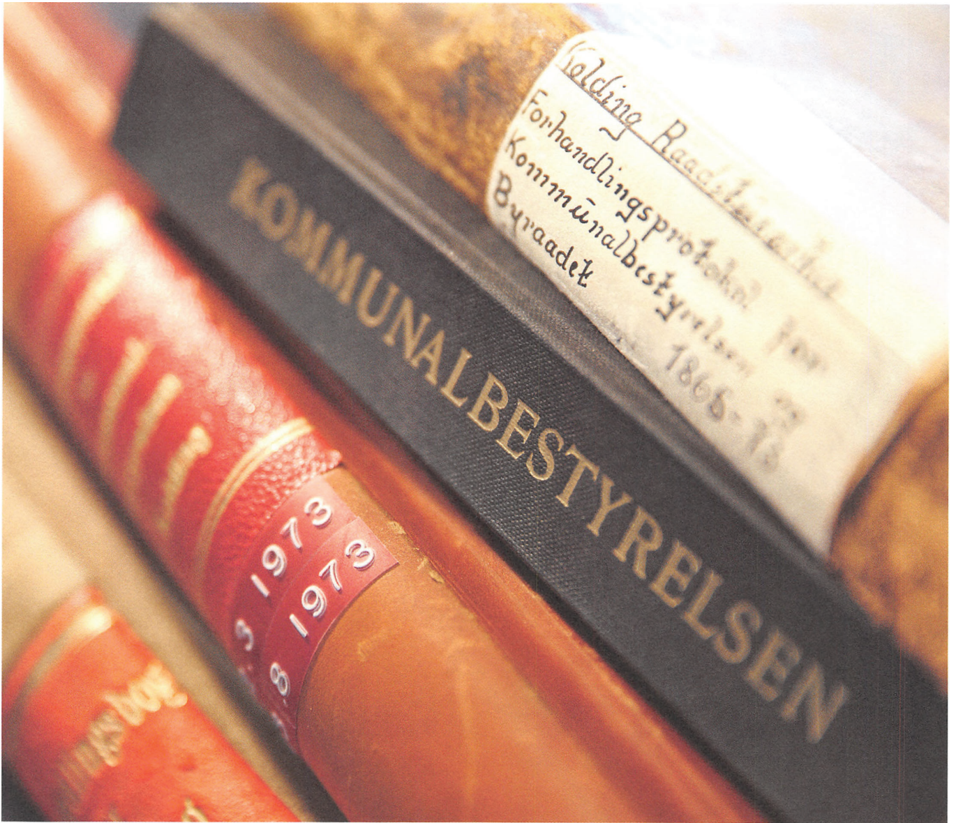
Kommunesammenlægningen i 2007 betød, at Kolding Stadsarkiv modtog arkivalier fra de tre tidligere kommuner: Vamdrup, Lunderskov og Christiansfeld.