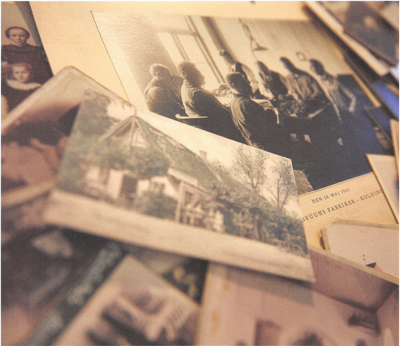
Siden start har billederne udgjort en vigtig og væsentlig del af arkivets samlinger.