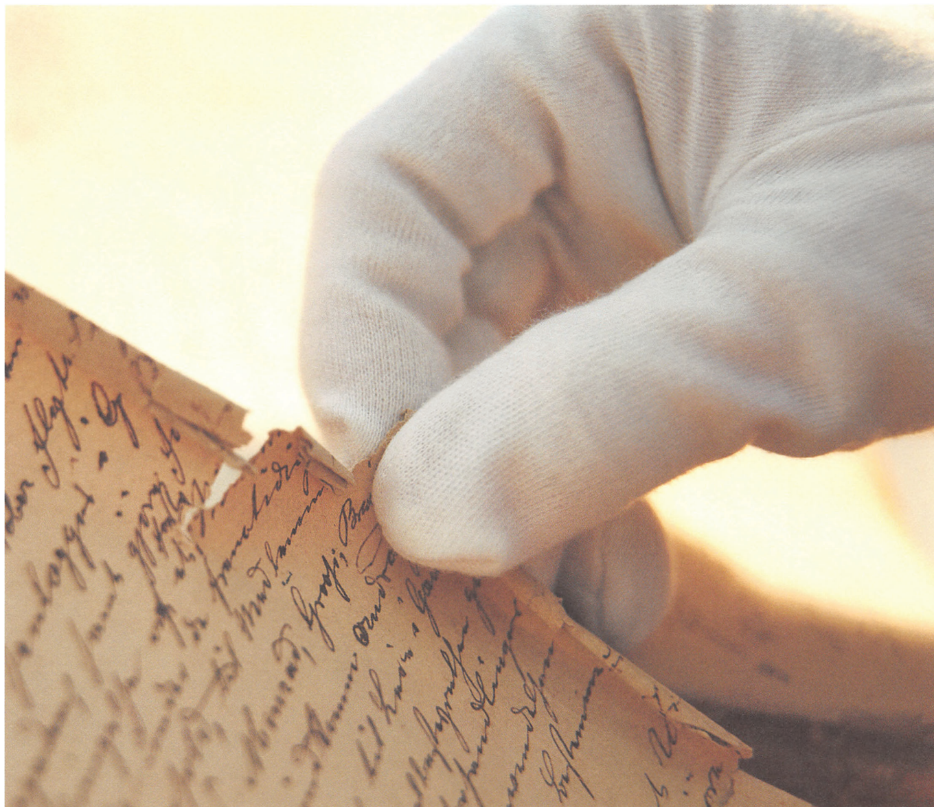
Stadsarkivets rolle er at vejlede forvaltningerne om arkivforhold. Tidligere var papirets kvalitet afgørende.