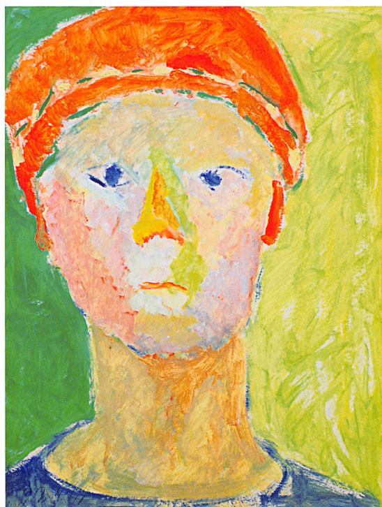
Olie på lærred. Privateje.