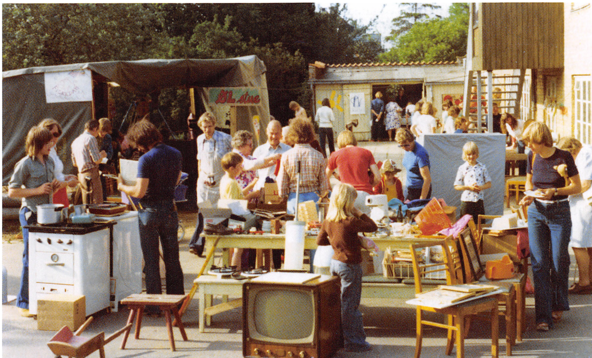
Sommerfest på Tinghøj, hvor også børn og personale fra Fuglehøj deltog, 1977.

blev vi langsomt vænnet til det, og vi fik mere og mere frihed...”