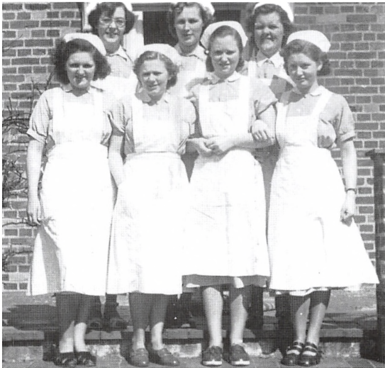
Elevholdet af barneplejersker på Fuglehøj, 1950-51.

merne. Børnenes hverdag domineredes af spisning, personlig hygiejne, søvn, pottetræning m.m. Der var ikke tid til eller fokus på stimulation af barnets øvrige udvikling, såsom sprog, leg o.a.