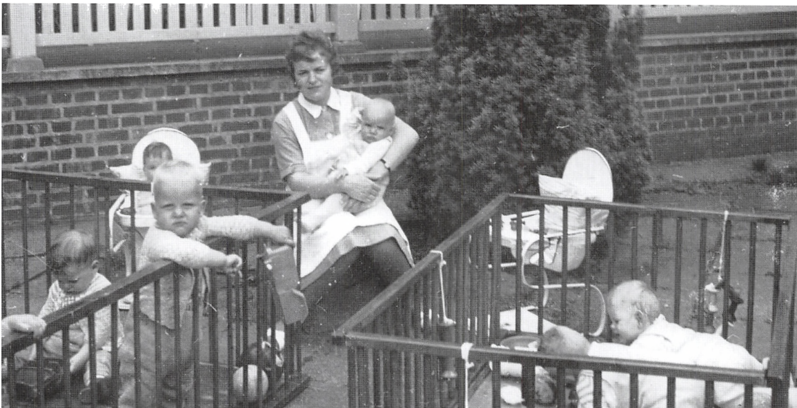
Barneplejerske med børn i kravlegårde på Fuglehøj, ca. 1955.

I forbindelse med Fuglehøjs 50 års jubilæum i 2000 blev der lavet et jubilæumsskrift, der beskriver institutionens historie primært fortalt af tidligere og nuværende medarbejdere og børn og unge, der har haft tilknytning til huset på forskellig vis.