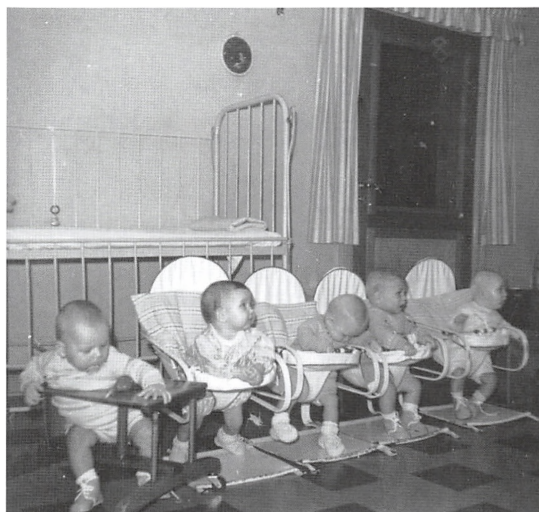
Børn på stribestole i siddestole, ca. 1955.

"I dagvagten, som lå mellem 7-18 (fritimer midt på dagen), bestod arbejdet i at passe og pleje børnene på de forskellige alderstrin. Det lå forstanderinden meget på sinde, at børnene havde det godt, at de skulle opleve stedet som et hjem. Omend en stor del af personalets arbejdstid var fyldt op med praktisk arbejde og regulære plejeopgaver, var personalet alligevel meget omkring børnene. Alt foregik på de samme få kvadratmeter. Børnene var også meget ude – på gåtur i den store