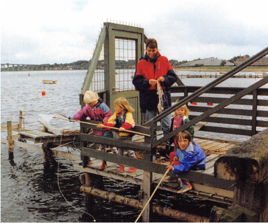
Børn fra Fuglehøj på fisketur på Kolding Fjord, 1994.

andre ting, som i den alder er vigtigt for at have et almindeligt socialt liv.