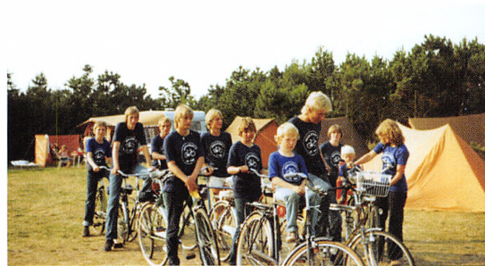
Børne- og Ungdomspensionen Fuglehøj på cykletur til Vesterhavet, 1981.

Jeg er rigtig glad for, at jeg har boet på Fuglehøj. Noget af det, jeg tager med, som de voksne har lært mig, er, at jeg skal stole på mig selv, at jeg er god nok, som jeg er. Det aller-allerbedste ved at ha’ boet på Fuglehøj er, at jeg har lært de voksne og nogle andre børn at kende.”