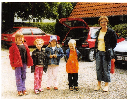
Børn og pædagog ved Fuglehøj, 2004.

Det fungerede kun i kort tid. Behovet for observationspladser steg, og ungepladser i den hidtidige form var der ikke længere efterspørgsel på. Siden midt i 1980'erne og frem til 2005 var Fuglehøj normeret til 12 observationspladser for børn i alderen 0-7 år fra familier med sociale og psykiske vanskeligheder, hvor børnene udviste trivselsproblemer fra fødslen, f.eks. spædbørn med abstinenser grundet moderens stofmisbrug under graviditeten eller som følge af omsorgssvigt. Fra Vejle, Ribe og Ringkøbing Amter modtog Fuglehøj også nyfødte spædbørn med henblik på bortadoption. Disse børn skulle udover pleje og stimulation observeres og beskrives i lighed med de øvrige børn. De skulle undersøges af en pædiater (børnelæge) og tilses nogle gange under opholdet for at sikre, at barnet fulgte en normal udvikling. For at barnet kunne blive bortadopteret, skulle det fremgå af en pædiater-erklæring, som, når barnet var 3 måneder, blev sendt til barnets hjemamt sammen med de pædagogiske udredninger. Når den biologiske mor havde skrevet under på adoptionserklæringen, blev alle papirer sendt til Adoptionsnævnet, som foretog matchning af barn og adoptionsforældre.