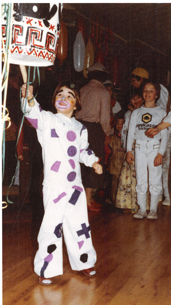
Fastelavnsfest på Fuglehøj.

Fastelavn, påske og jul blev fejret på behørig vis, ligesom ferieturene forår, sommer og efterår var til stor glæde for alle.