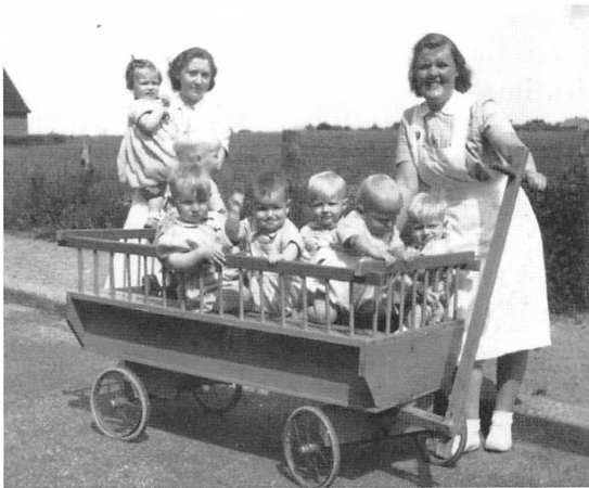
Børn fra Fuglehøj i trækvogn med to barneplejersker, ca. 1955.

opvækst. De er jo i dag voksne mennesker over 30 år og har forhåbentlig fået et godt liv. Selvom de startede livet på en institution, var det en dejlig fornemmelse som elev at være med til at give dem lidt varme og tryk, og det er måske denne følelse som gør, at dette år som elev på Fuglehøj husker jeg som en meget positiv tid.”