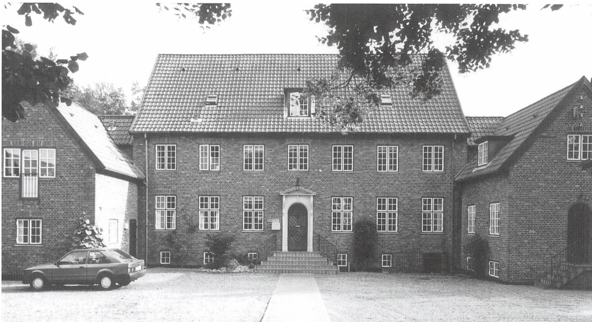
Fuglehøj, Dyrehavevej 101, opført efter tegninger af arkitekt Ernst Petersen 1927-30.

Man var nu blevet bevidst om, at barnet allerede fra fødslen var socialt orienteret og derfor kunne indgå i et følelsesmæssigt samspil med omsorgspersonerne.