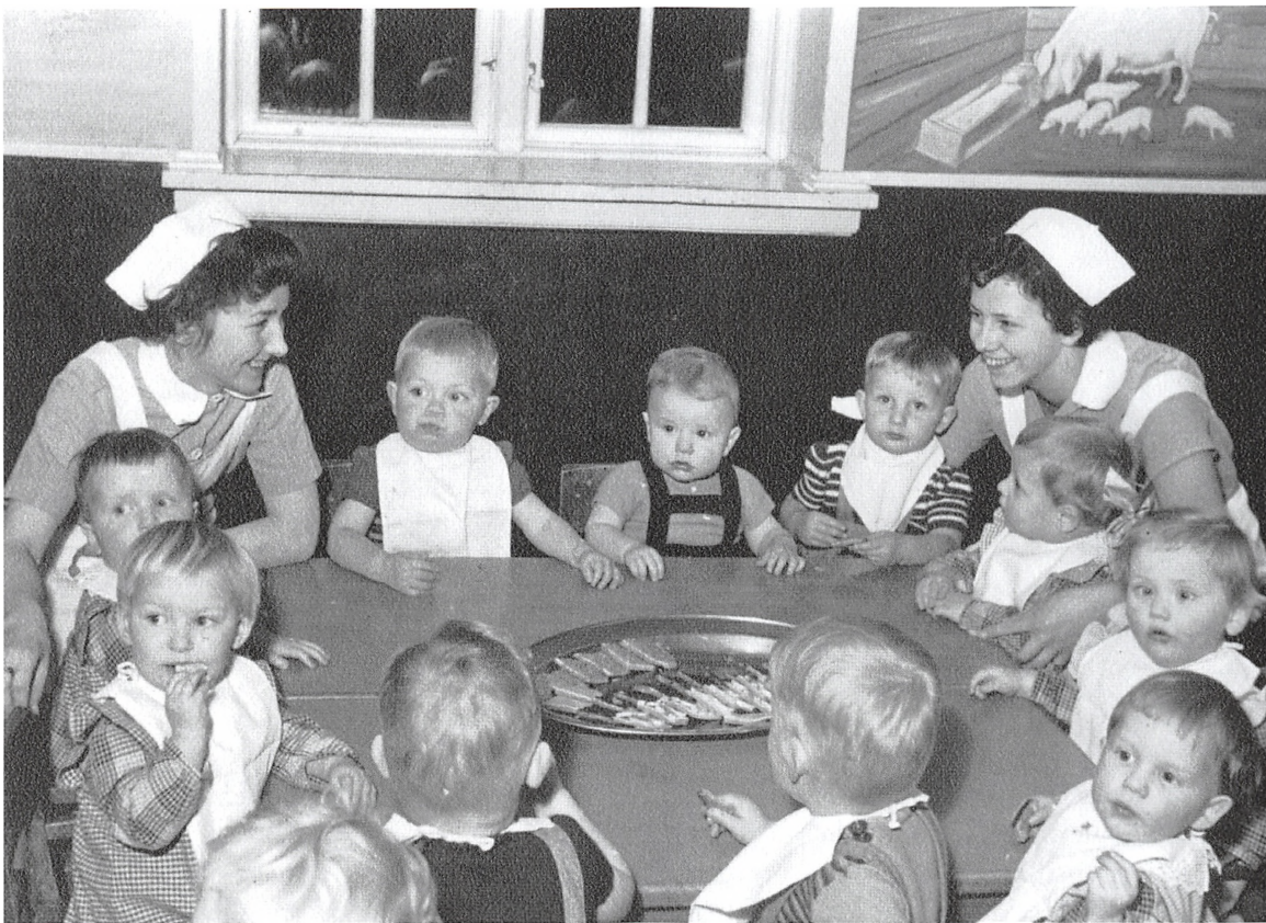
Børn og barneplejersker på Fuglehøj, ca. 1955.

ikke mulighed for dagpleje, vuggestue o. lign., så moderen kunne passe et arbejde, skole, uddannelse m.v. At være enlig forsørger ansås tillige som umoralsk. Børnene blev betragtet som "uægte". Mange af børnene blev bortadopteret eller kom i familiepleje, men de kunne også komme hjem til moderen igen, hvis hendes vilkår ændrede sig – hvis hun blev gift.