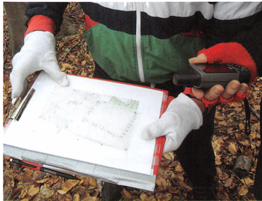
Korttegning i skoven.

Der er inden for de senere år kommet nogle nye hjælpemidler, som har gjort dette arbejde noget nemmere, først var det afstandsmålere og senest håndholdt GPS-udstyr. Men det er fortsat et tidskrævende arbejde at rekognoscere et kort. Det tager normalt mellem 15 og 30 timer pr. km 2 . Gennem årene har 64