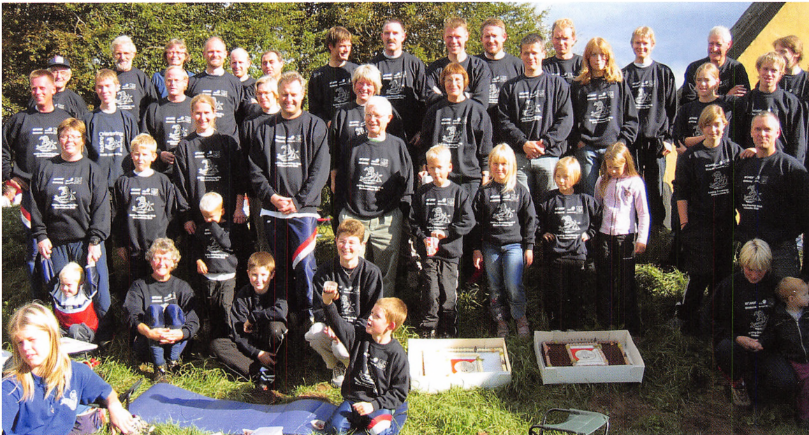
Ved Dansk Orienteringsforbunds holddivisionsfinale i 2005 vandt Kolding Orienterings Klub bronze. Holdet ses her.

mesterskab. Den anden og lidt større aktivitet er orienterings biathlon – en kombinationssport, der består af orienteringsløb og skydning mod faldmål. Kolding OK er en af landets førende klubber på dette område og har gennem de seneste 10 år vundet adskillige danske mesterskaber. Internationalt har klubben også hentet både EM- og VM-medaljer.