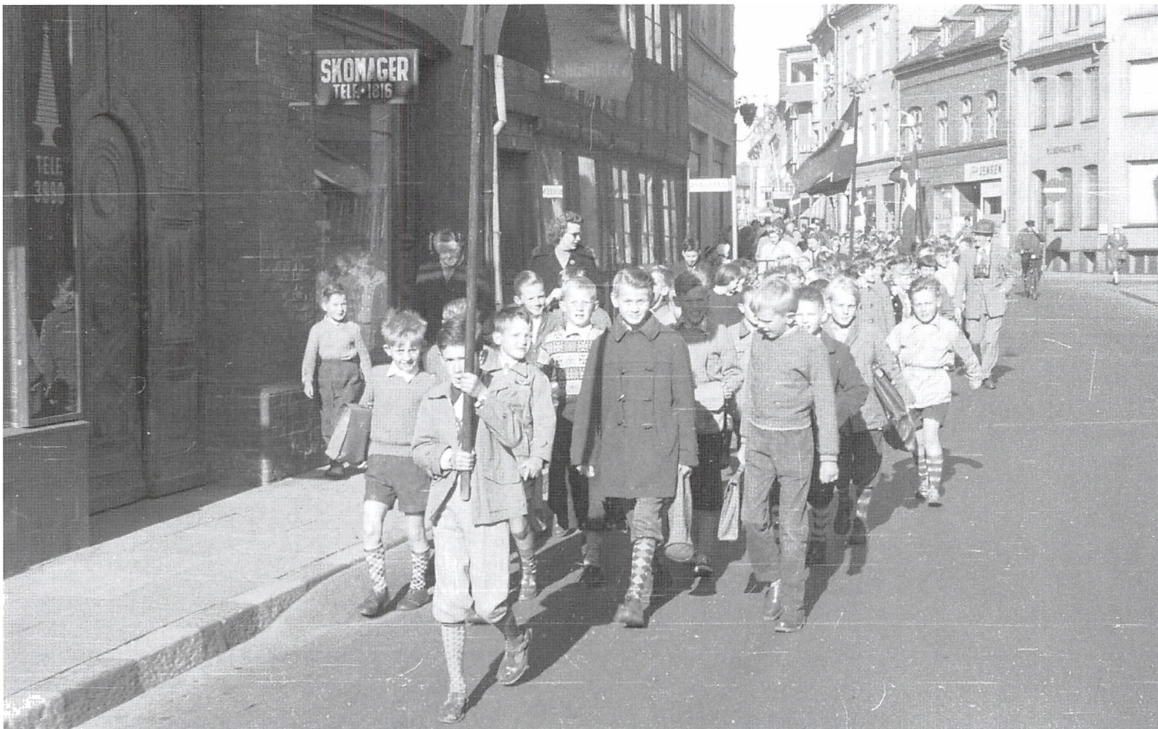
Riis Toft Skoles udflugt den 10. maj 1957 i Klostergade på vej til Banegården. Turen gik til Nyborg.

slog tre udvalgte personer hvert sit søm i fænestangen, ledsaget af alvorlige ord.