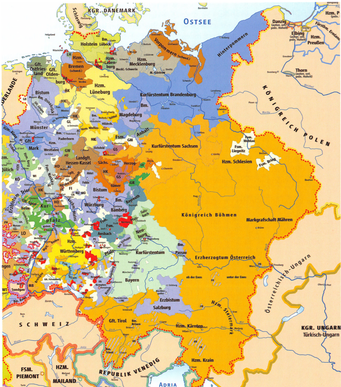
Det tysk-romerske rige i 1648.