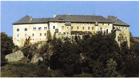
Borgen Hollenburg i Kärnten.

samme navn udbyggedes til et af de centrale borganlæg i Kärnten.