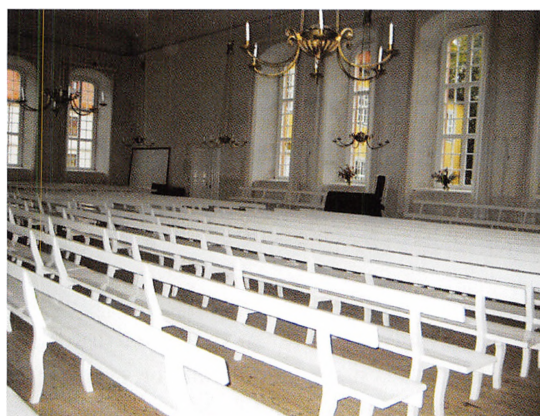
Kirkesalen i Brødremenighedens kirke i Herrnhut.

Men herrnhuterne var ikke bare en fortsættelse af den bøhmiske brødretradition.