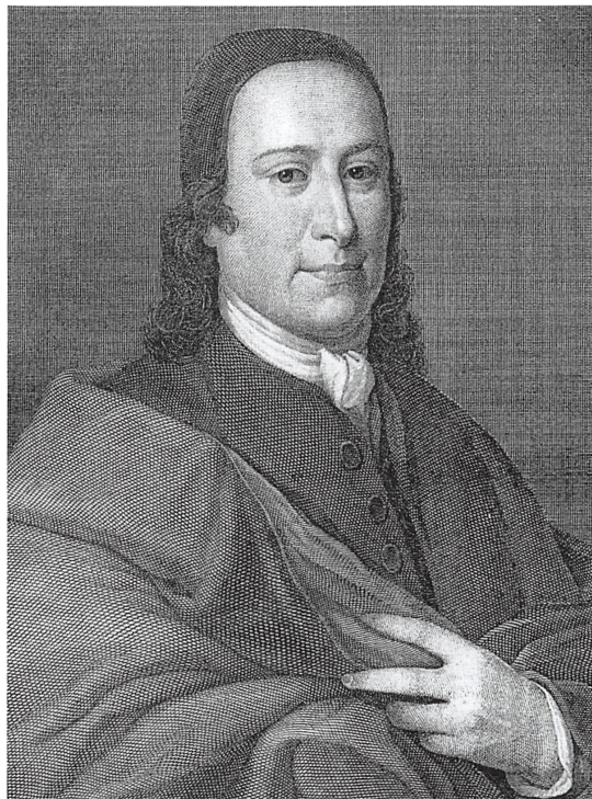
Nikolaus Ludwig von Zinzendorf.

Zinzendorf gav flytningene lov til at oprette en koloni på godset Berthelsdorf. Bosættelsen fik navnet Herrnhut og tiltrak ikke kun mähriske og bøhmiske brødre, men også tilhængere af andre religiøse samfund fra nær og fjern. Denne mangfoldighed bød på mange udfordringer, da den gjorde det vanskeligt at enes om en fælles troslære og ikke mindst at indordne denne i den lutherske saksiske statskirke. Det var her, at greve Zinzendorf igen viste sig at være uundværlig for det nye kirkesamfund. Ikke bare havde han sikret den økonomiske basis ved at stille sit gods til rådighed. I sin stilling som kirkepatron kunne han give tilflytterne en vis beskyttelse mod ortodokse kirkekredse, som nok ikke uden grund betvivlede de nyankomnes lutherske