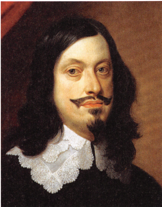
Kejser Ferdinand III efter Politikens bog om Trediveårskrigen.

nedre-østrigske adel bøjede sig og undveg derved kejserens bandlysning. Mens hele den protestantiske adel i Øvre Østrig i 1627 og Indre Østrig i 1628 måtte vælge mellem at konvertere til katolicismen eller at udvandre, blev deres tilbageværende nedre-østrigske standsfæller forskånet.