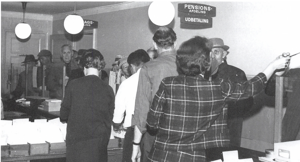
Udbetaling af folkepension på Socialkontoret på Rådhuset.

op og lagde pengene på lønsedlen. Den anden skulle tælle efter og putte penge og seddel i posen og derefter sætte den i trækassen. Når portionen af pengene og sedlerne var opbrugt, måtte der naturligvis ikke være penge tilovers eller mangle nogle. Det skete selvfølgelig, og så måtte vi gennemgå alle poser igen. Jeg må indrømme, at det er sket, at der har manglet et mindre beløb på f.eks. 1 eller 5 kr., og så er det sket, at den ansvarlige for kontroltællingen har lagt pengene i. Hvis der var for mange tilbage, så var der kun den udvej at eftertælle. Når alle poser var pakket, blev de klipset sammen og trækasserne sat ind i kontorets boks.