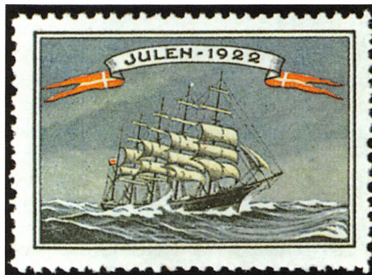
Julemærket fra 1922.

Efter jul blev de julemærker, der ikke var blevet solgt, destrueret, men da der normalt var postekspedition på jernbanestationerne, blev der her gemt nogle ark, som blev brugt af dem, der havde nattevagter på stationerne. De brugte de kasserede julemærker til at klipse ind i nogle fotoalbum, som blev sendt fra station til station i hele Sønderjylland. På hver station blev der lavet en kollage ved hjælp af mærkerne, samt en hilsen fra de forskellige stationer til børnene på sanatoriet. Det var blevet en tradition, så der var mange fotoalbums, 2-3 stykker fra hvert år. Hvor langt tilbage kan jeg ikke huske, men der var mange. Især kan jeg huske mærket fra 1922 med skoleskibet København. Der var en station, der havde lavet julemærket, så det fyldte en hel side i albummet. Det var samlet af tusinde af udklippede dele fra mærkerne. Der er masser af skumsprøjt på motivet og hvert skumsprøjt er klippet ud af mærket og sammensat til det tilsvarende på det store i albummet. Det må have taget mange timer at lave. Siderne i albummet var ca. 22 x 30 cm.