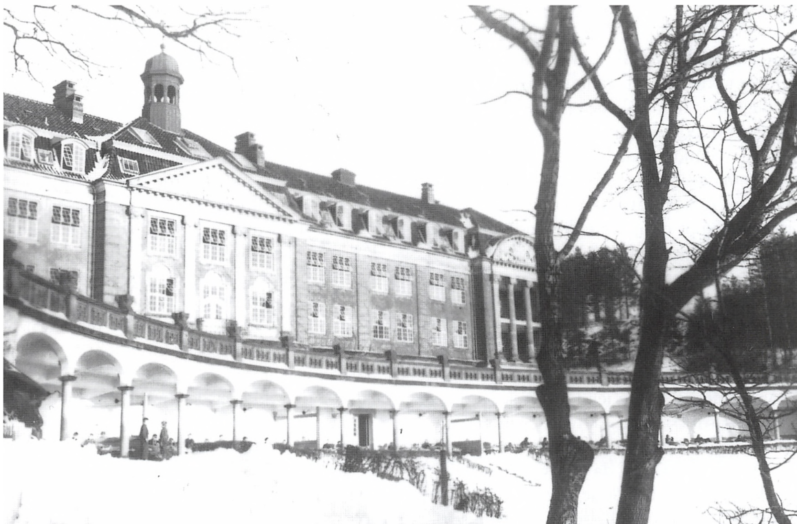
Børn i liggehallen i snevejr.

I spisesalen kørte alt efter en snor. Hver afdeling havde deres bord eller borde. Maden blev hentet ved madlugen til hvert bord af to fra hvert bord. Det gik på omgang. Vi havde drengene fra afd. D ved vores bord, der var