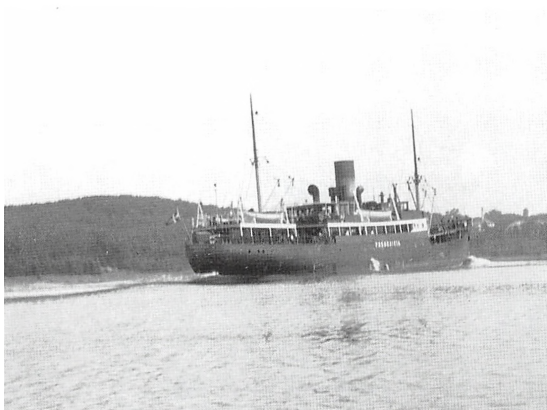
"Fredericia" på fjorden.

dengang "Statsradiofonien", optog en udsendelse fra sanatoriet. Det lille kor, jeg var med i, skulle igen synge, og jeg skulle synge solo, i radioen. Så'dan! Begivenheden er nok ikke blevet bevaret (forstå det, hvem der kan), da det blev optaget på det moderne stålband, som man kunne slette og bruge igen. Det var et rigtigt stålband, som man bandt sammen med en knude, hvis det skulle gå hen og springe.