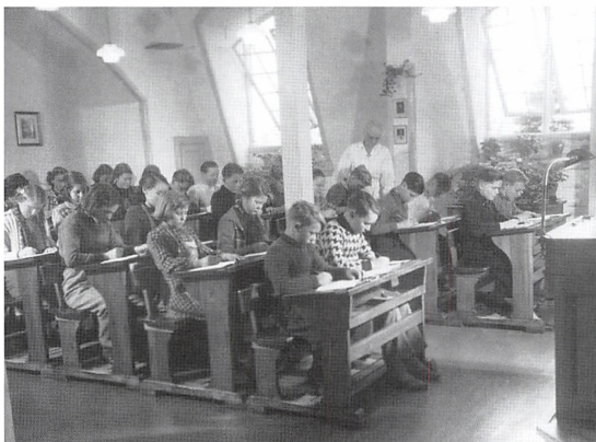
Skolestuen på Julemærkesanatoriet.

Der var mange både, som passerede forbi på fjorden. Fiskekuttere, skonnerter, kreatur-