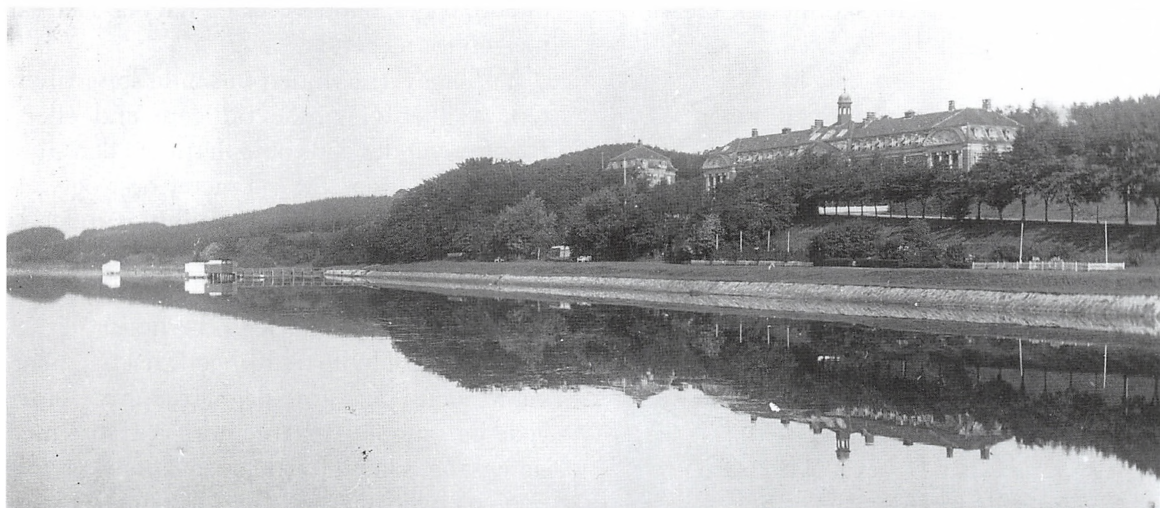
Julemærkesanatoriet set fra fjorden.

Ca. en gang om måneden, sådan husker jeg det, var vi i bad. Det foregik i kælderen, hvor der var badeanstalt. Der var en 4-5 brusere og 3-4 badekar. Det var nok til én afdeling. En gang i mellem, fik vi, en 5-6 stykker, et ekstra bad, hvis vi kunne overtale en af de unge sygeplejersker. Det foregik om aftenen, og så