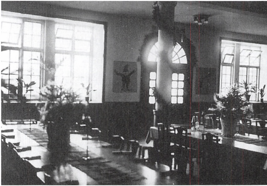
Spisestuen pyntet op til jul.

kun 4-5 stykker, så vi var ca. 20-22. Når maden var hentet, øste en sygeplejerske op, og de to "hentere" serverede. Så sad alle og ventede, til vi alle havde fået, og der blev sagt: "Vær så god". Når alle havde spist op, blev tallerkenerne samlet sammen og afleveret ved lugen, og man stillede op på en lang række – over hundrede børn – og gik forbi "plejemor", gav hånd og sagde: "Tak for mad". Tre gange om dagen!