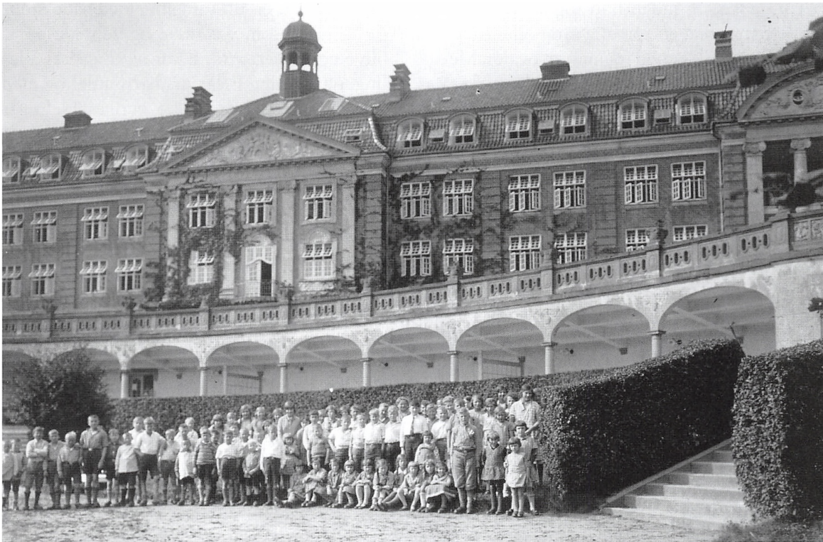
Børn foran Julemærkesanatoriet ca. 1950.

Lørdag den 6. maj 1950 kørte vi – mor, far, mormor, morfar og mig i morfars Opel Kapitajn, af sted til Kolding. Jeg tror ikke far havde andet end lastvognen dengang. Vi standede i Skanderborg ved Aage Seerups urmarforretning. Jeg fik mit første ur, et Certina armbåndsur. Det kostede 200 kr., og det var mange penge dengang, men det holdt også i over 30 år, hvorefter det forsvandt under en øvelse på en rafting-tur i Tyskland.