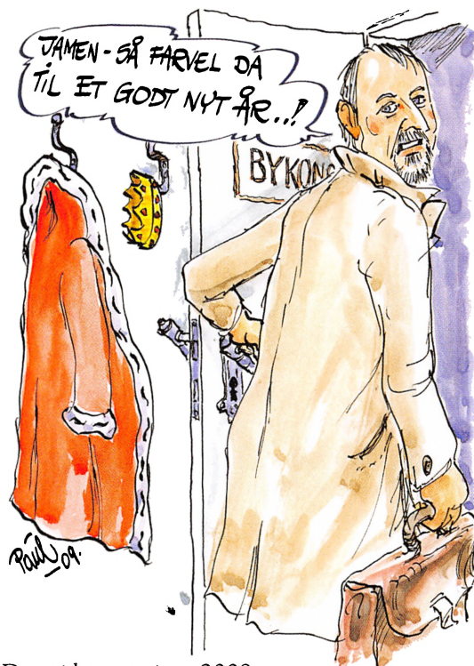
Den sidste tegning, 2009.