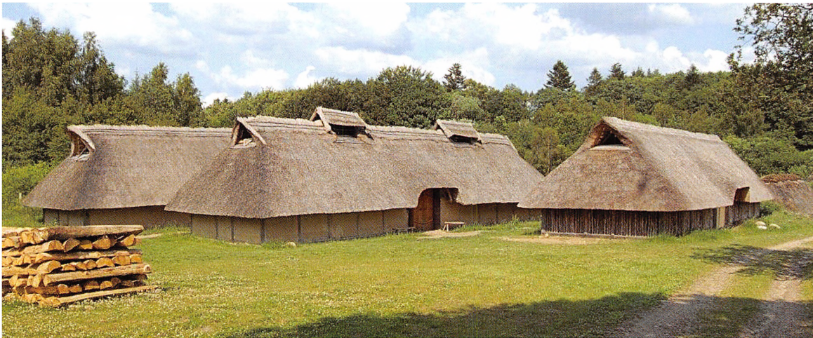
Rekonstruktion af stormandsgård vest for Stepping Mølle.