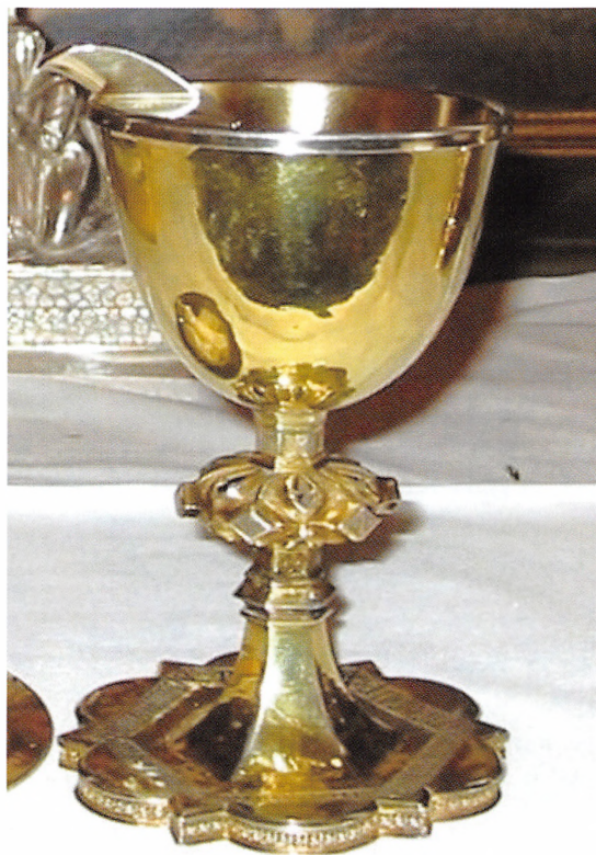
Stepping Kirkes alterkalk fra 1450.

Jernaldersamfundet vest for Stepping Mølle er de første spor, vi har fundet af mennesker i Stepping Sogn. Der har formentlig ikke