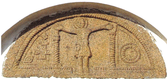
Tympanon over indgangsdøren til Stepping Kirke.

Kirke udvidet mod vest, der blev bygget tårn, våbenhus og sakristi.