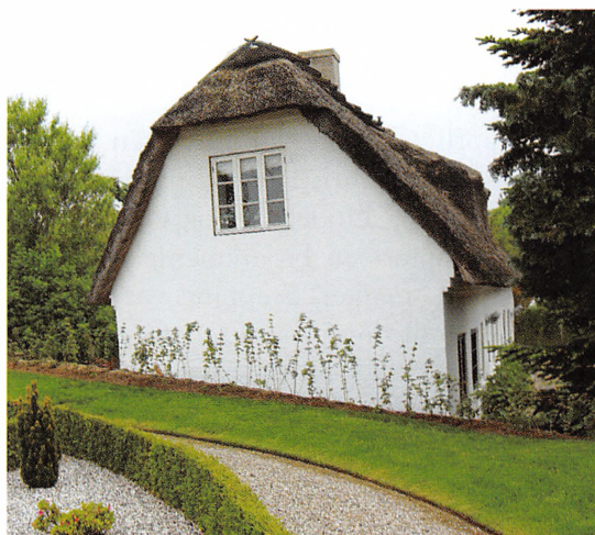
Brødremenighedens "søstrehus" fra 1745 – udvidet i 1809.