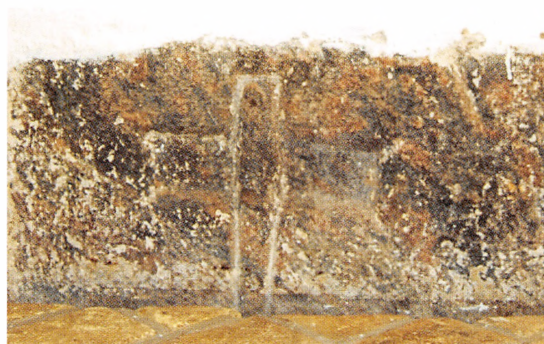
Thors hammer i Stepping Kirke.

dus" fra kejser Anastasius' tid (491-518). Vi ved, at vikingerne har bevæget sig vidt omkring på deres togter, og af og til har man også fået besøg af handelsfolk sydfra. Disse kontakter førte til, at kristendommen kom til området. Der er formentlig bygget en lille trækirke i sognet allerede omkring år 1000, som omkring 1150 blev afløst af den nuværende stenkirke. I 1400-tallet blev Stepping