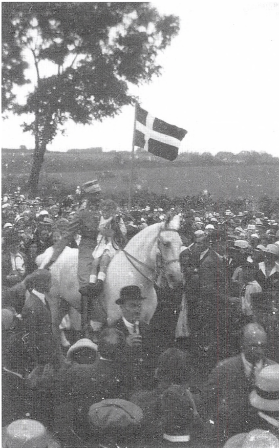
Christian den 10. rider over grænsen ved Frederikshøj den 10. juli 1920.

Mens Christian den 10. sammen med sit følge var til andagt inde i Tyrstrup Kirke, stod hun ude ved hans hest. Den stod og åd græs, pigen klappede hesten, og den kvitterede med at køre sin mule op og ned af hendes fine hvide kjole. Men hvad gjorde det, at kjolen på den måde fik grønne striber; det var jo trods alt kongens hest, og det var jo trods alt en helt særlig dag, som hun sammen med mange andre sønderjyder havde set frem til