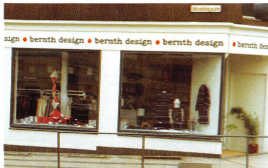
Forretningen set fra Munkegade, ca. 1975.

der. Hun kom fra en af vore kunder i Viborg, en anerkendt brugskunstbutik, så hun var godt kendt med det nye varesortiment, vi gik ind i. Vi åbnede i august, men radiobutikken i Munkegade var ikke nem at sælge videre, så vi besluttede at åbne endnu en butik. I november startede vi så også en butik med ting til boligen. Vi havde fået den idé at sælge kurvemøbler, der var sprøjtelakerede i forskellige farver. Desuden solgte vi kludetæpper, ting til badeværelset, og så havde vi fået forhandlingen af de finske stoffer fra Marimekko. Plakater og skifterammer var også en del af varelageret.