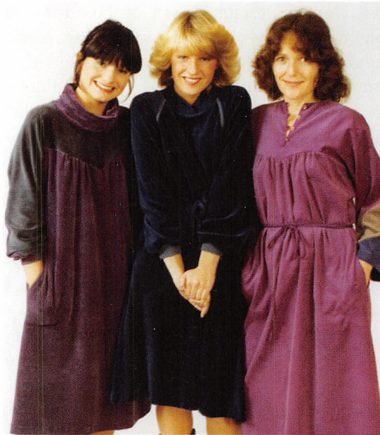
Karakteristiske Bernth-kjoler i velour og fløjel fra sidst i 1970erne.