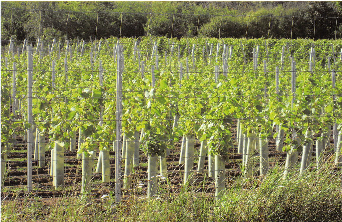
Skærsøgårds vinmarker i Dons, 2010.

stå, men i en helt anden form end den, vi hidtil har kendt. "Falmethed" kan vendes til "blomstring", men det kræver fantasi og initiativ. Måske er løsningen nye virksomheder som Skærsøgårds vinavl. Man køber en gård med jordtilliggende, som egner sig til vinavl, køber omliggende nedlagte ejendomme op, og i løbet af få år har man en vinindustri med fine bygninger og et stort produktionsapparat og anerkendte vine. Det er en præstation. Mange folk kommer i arbejde, bygninger bliver sat i stand og vedligeholdt. Vinavlen på Skærsøgård har igen bragt Dons på landkortet!