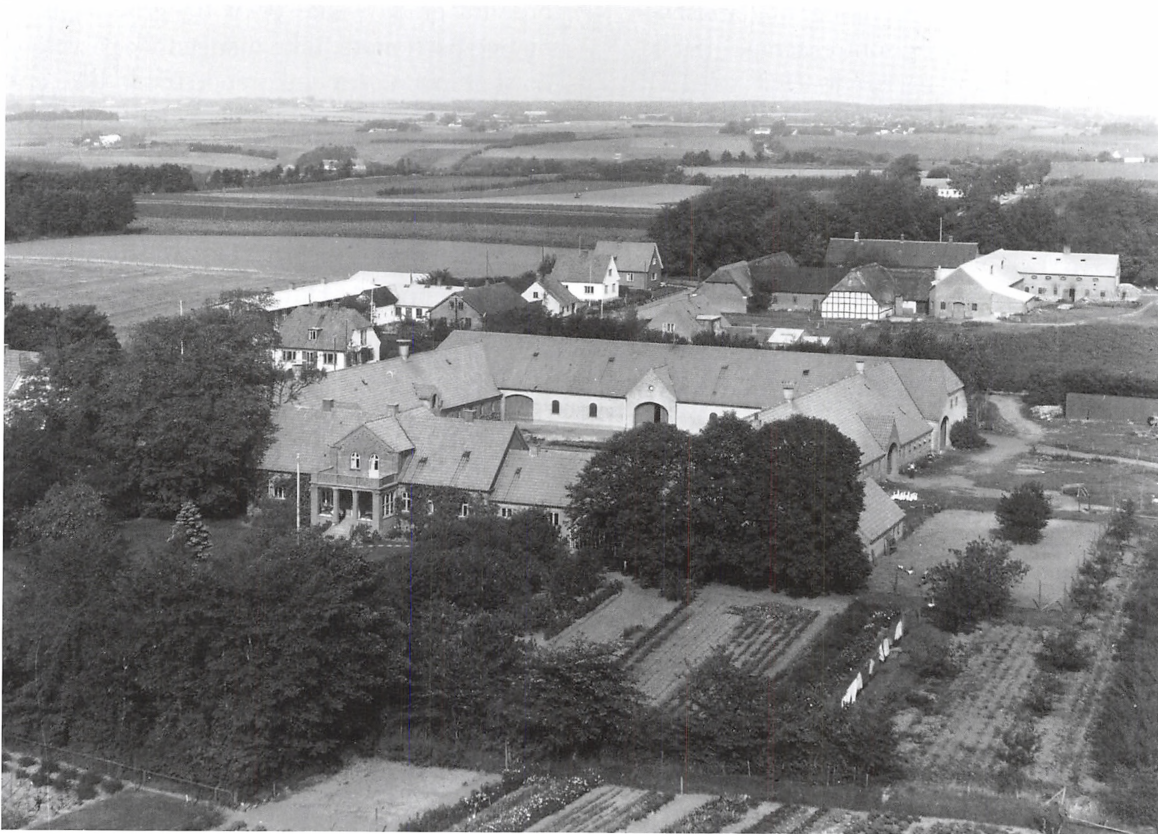
På dette foto ser vi landsbyen Dons i sin "velmagtstid". Det er gårdene Kristiansminde i forgrunden og Ravngård i baggrunden. Begge på højre side af vejen og på den venstre side af vejen småindustrier og privatboliger, 1955.

Ravngård er en firlænget gård med brolagt