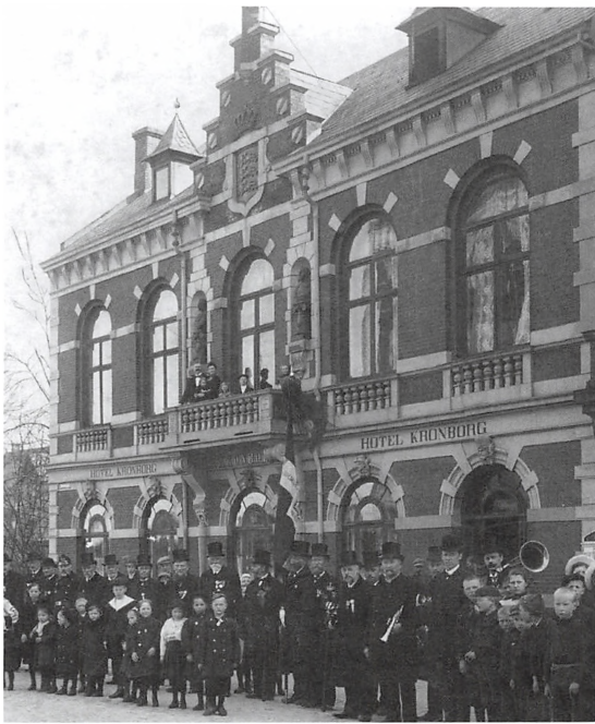
Hotel Kronborg med soldater og deres børn opstillet foran, 1923.