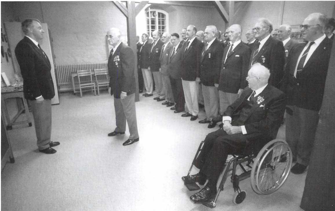
Parole i Staldgården ved Garderforeningens 90 års jubilæum i 1994.

af en uheldig episode med et løbsk projektil gennem et parcelhusvindue i Bramdrupdam, der i disse år vokser eksplosivt – men selv om Trekantsskydningerne fortsætter, følger ånden fra Komarksbuskene ikke rigtigt med.