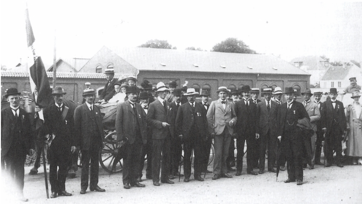
Kolding Garderforening på udflugt med fanen, 1917.