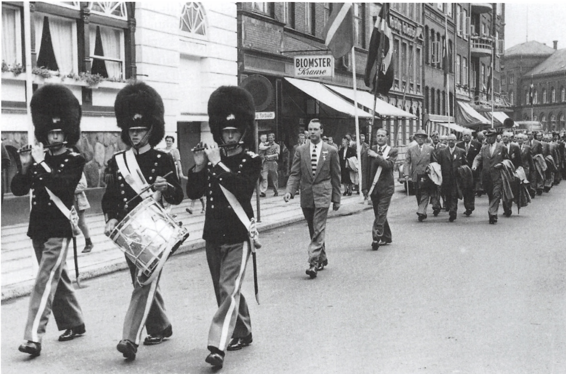
March gennem byen i anledning af Kolding Garderforenings 50 års jubilæum i 1954.

Det kan dog ikke overskygge forventningen til Den kongelige danske Livgardes 300 års jubilæum i 1958. Tilslutningen er så stor, at bestyrelsen lejer hele Hotel Nørrevold til at huse Koldings deltagere. I alt tager 140 mand turen til København, og den 10.000 mand store parade gennem hovedstadens gader indvarsler så at sige de optimistiske 1960-ere.