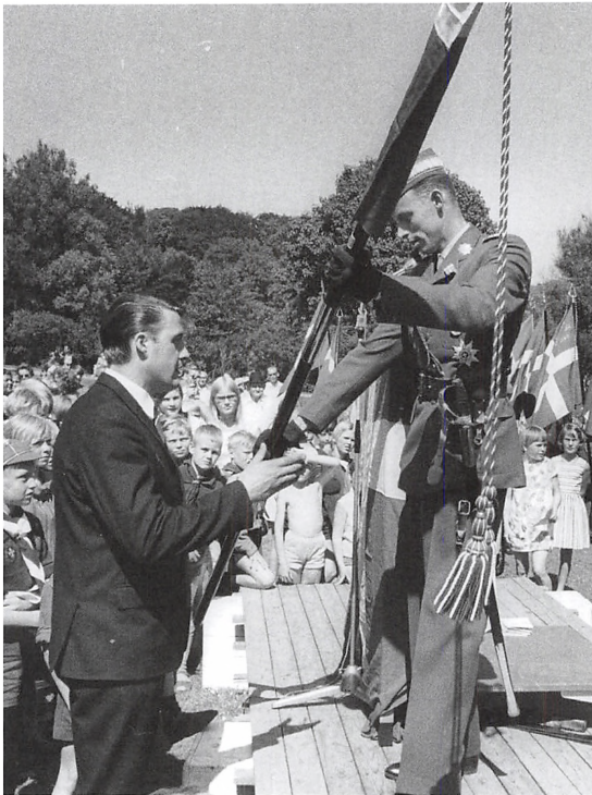
Grev Ingolf uddeler faner på Valdemarsdagen i 1968.

min bror er søofficer. Selv er jeg major af reserven og havde rådighedspligt, til jeg fyldte 60. Jeg har kun haft gode oplevelser i mine mange år som garder, siger Grev Ingolf, der i 1962-1964 uddannede sig til premierløjtnant i Den Kongelige Livgarde. Ved den lejlighed meldte han sig i Nordre Birk Garderforening i Lyngby. Et medlemskab han har bevaret, selv om han senere flyttede til Egeland.