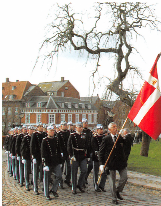
Blå Fest. De unge gardere marcherer op mod Koldinghus.

Men ellers er 2004 jo det store jubilæumsår, hvor Garderforeningen for Kolding og Omegn fylder 100 år. Det skal selvfølgelig fejres på alle tangenter, og bliver det. Kolding udpeges som værtsby for årets repræsentantskabsmøde i De danske Garderforeninger, og bestyrelsen sætter et flot program sammen for de tre dage, som mødet strækker sig over. Livgardens Musikkorps giver koncert sammen