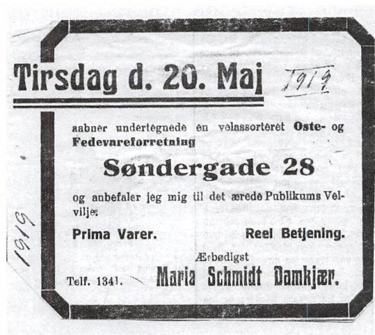
Åbningsannonce, maj 1919.