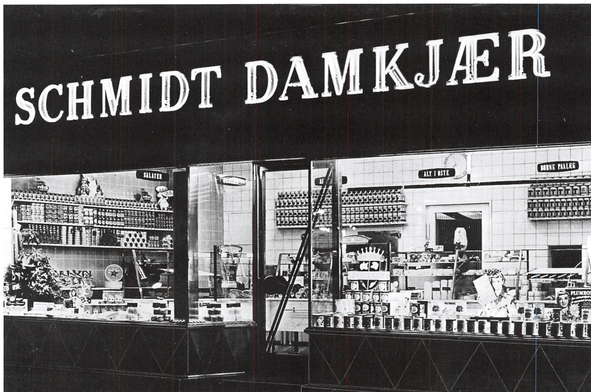
Den nye forretning i Søndergade 32, indviet i 1955.

mærksomhed i restauranter, når hun efter middagen tænder sin "damecerut" og ikke den almindelige cigaret.