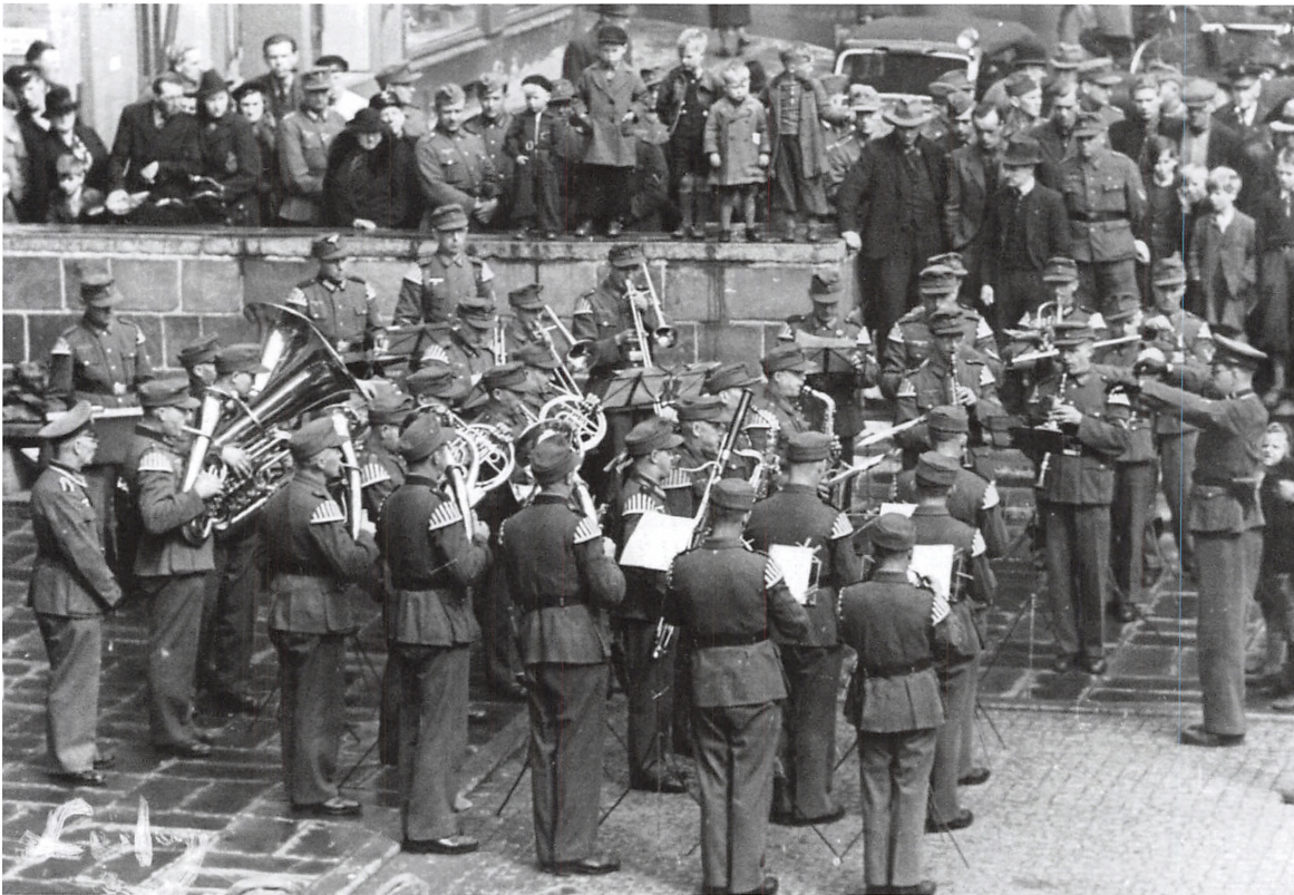
Tysk militærorkester spiller på Akseltorv.

Først, da der blev en lille pause, lykkedes det mig at smutte over og få købt aviserne.