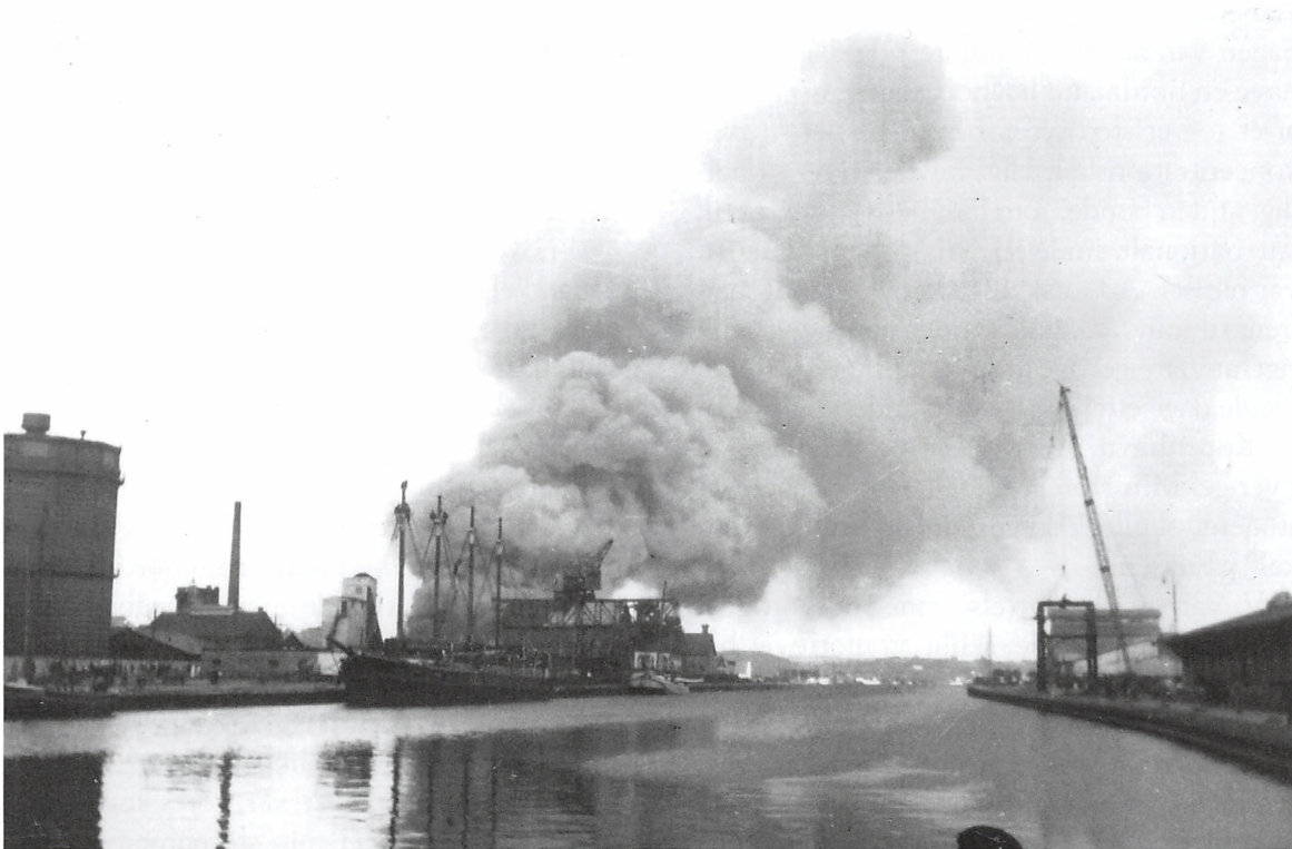
Røgskyen efter sabotagen på Kreaturstaldene på Kolding Havn 23. august 1943.

løbe med blodet dryppende ned over hovedet.