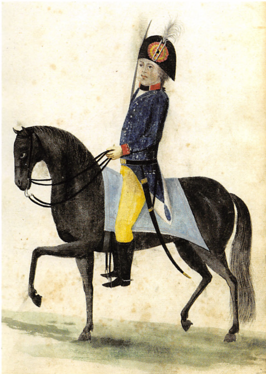
Tegning af det menige ridende korps i Borgervæbningsens protokol fra 1802-1804.

Den store dag kom lørdag den 11. september 1790. Det nygifte kronprinsepar ankom til Kolding kl. 11 om formiddagen.