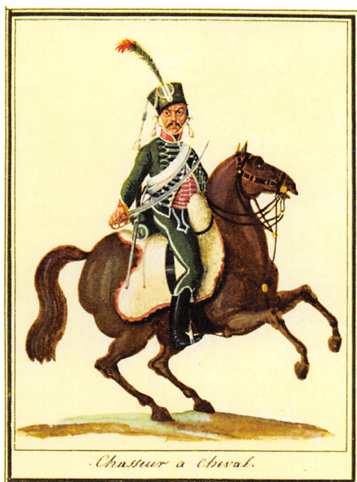
Fransk officer af det 11. jægerregiment.