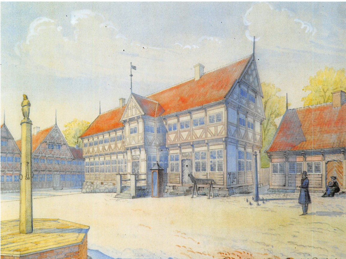
Rekonstruktionstegning af Kolding Rådhus, som det menes at have set ud o. 1800. Tegningen er udført af arkitekt Ernst Petersen på grundlag af arkivoplysninger indsamlet af I.O. Brandorff.

Det kunne Castonier naturligvis ikke vide, men han fik besked fra oberst Sache om, at