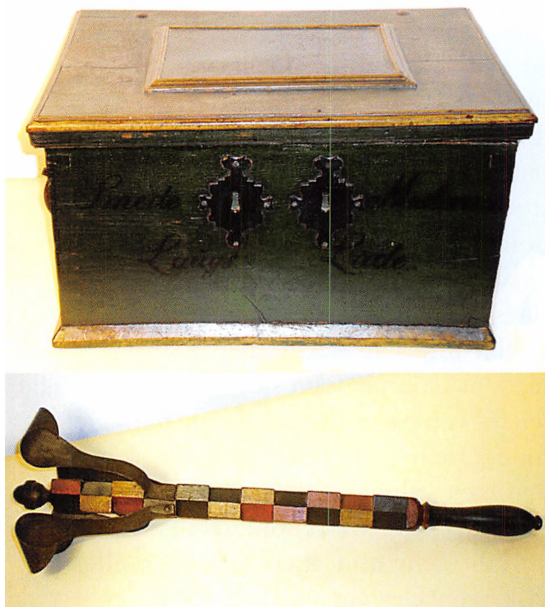
Smedelavets lade og skafferstok i Museet på Koldinghus.