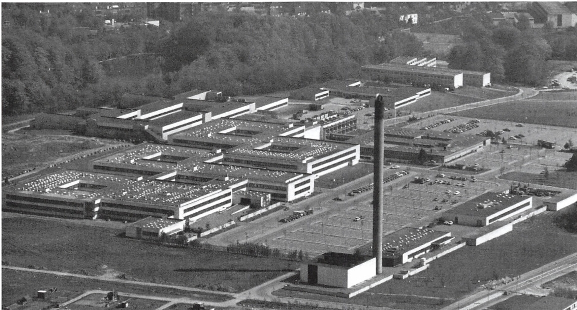
Kolding Sygehus fotograferet i 1985.