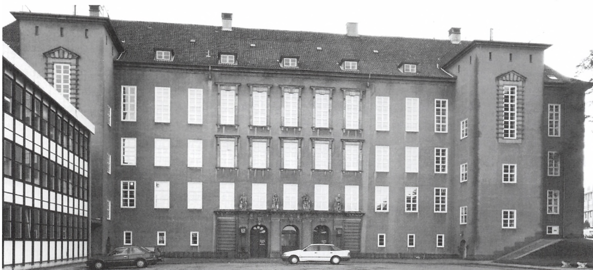
Kolding Domhus. 1992.

Jeg har nu gennemset begge videobånd og vil lægge dem væk, langt væk, for jeg håber ikke foreløbig at skulle gense disse.