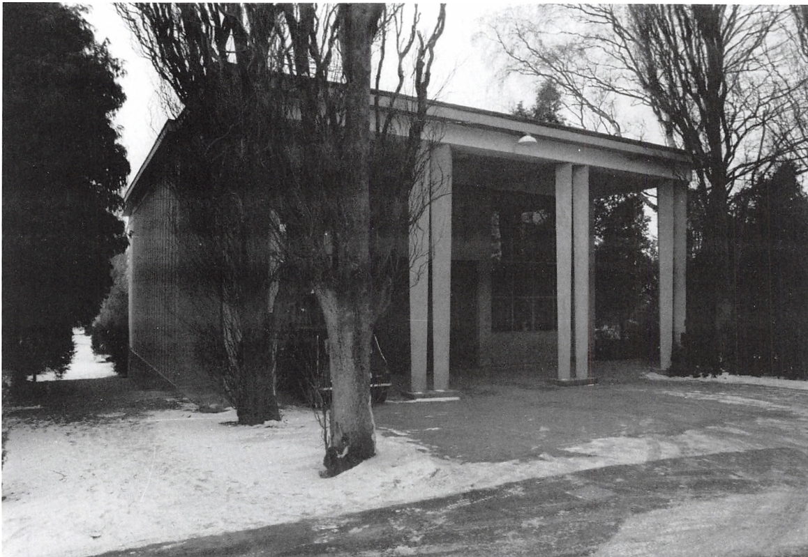
Krematoriet på Sdr. Kirkegård, fotograferet 13. februar 1986.

Den sigtede var en fedladen bleg mand, der ved retsmødets start indledte med at hilse på mig ved at give mig et slattent håndtryk. Nok er jeg ikke sart, men alligevel kunne jeg ikke undgå at tænke på, hvad han for nylig havde brugt denne hånd til. Under afhøringen af den sigtede erkendte han såvel indbruddene i krematoriet som den efterfølgende ligskænding.