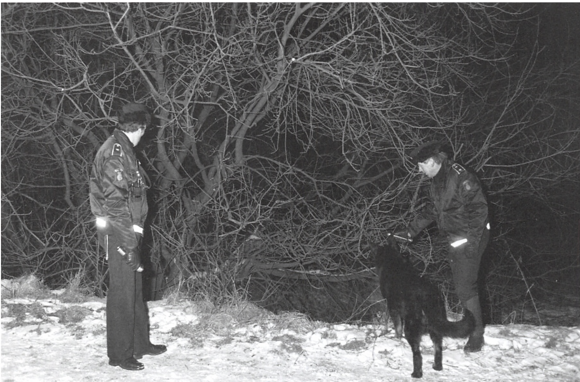
Eftersøgning med hunde i skovområdet ved Kolding Gymnasium 10. februar 1986.

Det var der to lig, der gjorde. Alle kunne ånde lettet op, da vi kunne genforene de afskårne lem med deres ejermænd. For selvom der stadig var tale om en afskyelig og grotesk forbrydelse, var der ikke tale om drab.