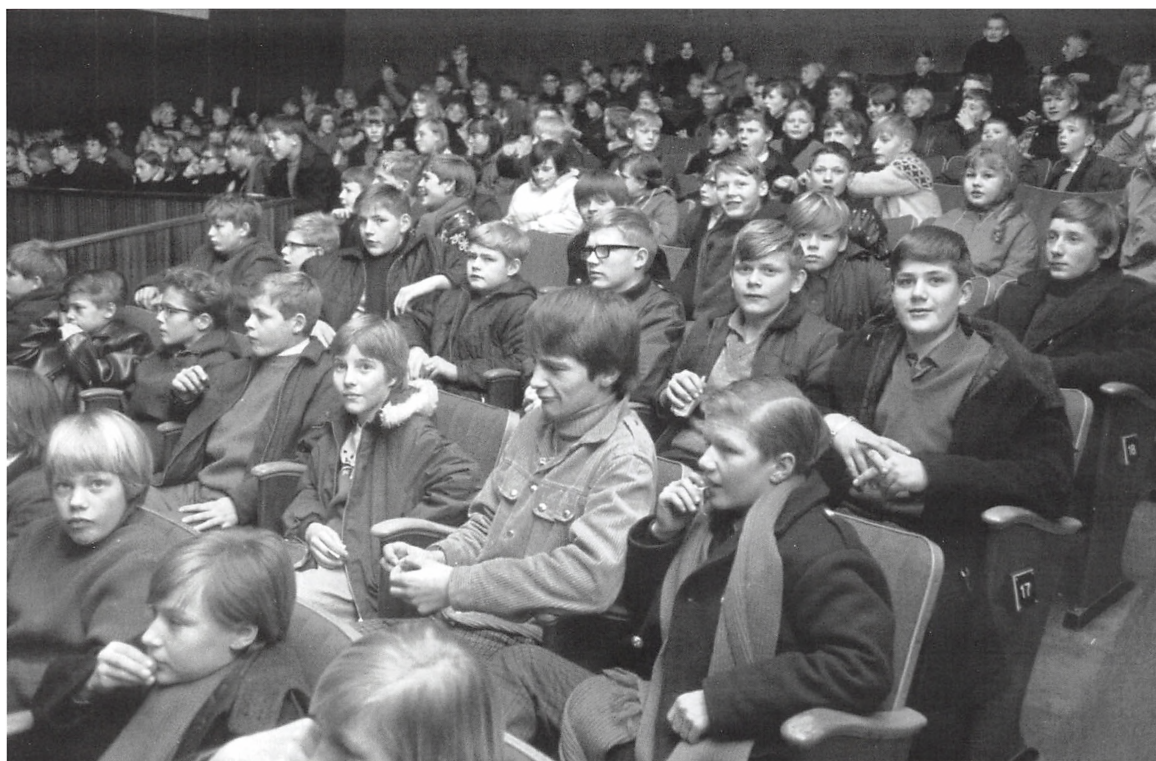
Filmforevisning for Skolescenens Bio i "Kino" februar 1967.

des det imidlertid ikke Kolding Kommune at få en afdeling af Skolescenens Bio op at stå i denne sæson. Tidligt på foråret havde Kulturudvalget ellers diskuteret sagen med biografdirektør P. A. Høj og udarbejdet en liste over, hvilke dage i løbet af vinteren, udvalget kunne disponere over "Kino" i Søndergade. Men da disse ikke harmonerede med de spilledataer, Skolescenens Bio kunne tilbyde, og da disse ikke stod til forhandling, valgte udvalget at takke nej til tilbudet og i stedet genoptage forhandlingerne på et senere tidspunkt med henblik på at indgå en aftale vedrørende den ny sæson. 9)