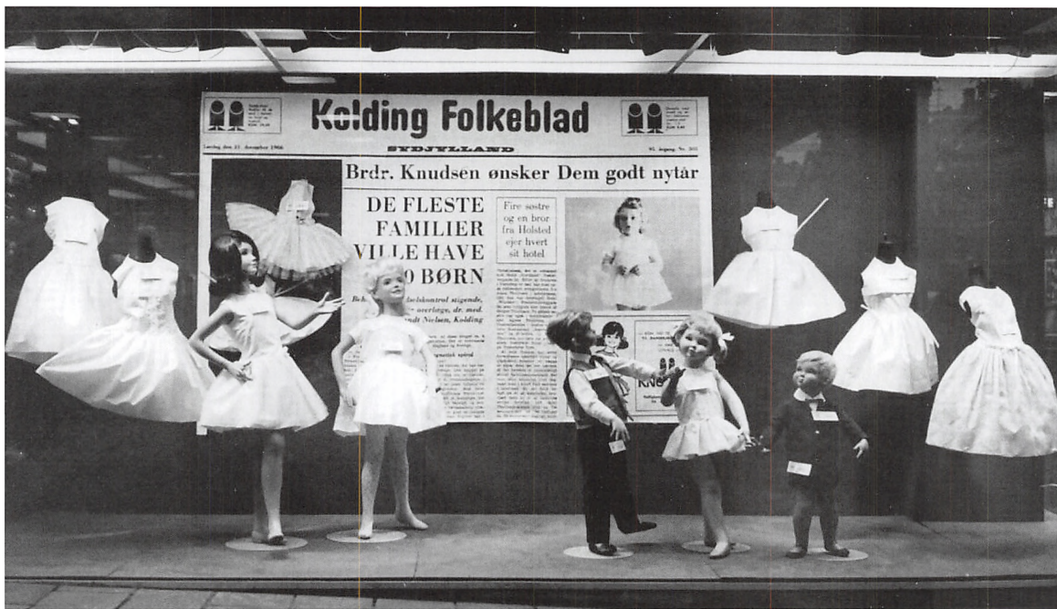
Der blev gjort meget ud af vinduespyntningen, som her ved optakten til byens afdansningsballer.