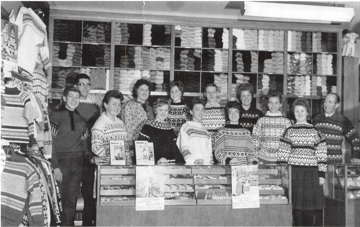
Personalet i 1961 iført håndstrikkede Fasan trøjer.

den gammeldags diskbetjening, men vi var klar over, at vi langsomt skulle over til "selvvalg" – en lettere form for selvbetjening. Vi startede med lave diske, hvor der kunne ligge f.eks. strømper, som kunden selv kunne røre ved og måske i heldigste fald selv kunne finde den rette størrelse og farve etc. Den største "hurdle" som vi skulle over, var dog personalets indstilling til dette her "nymodens". De var jo vant til at stå trygt og godt bag ved disken, godt beskyttet. Nu skulle de pludselig stå ved siden af kunden i tæt kontakt. Det voldte mange problemer.