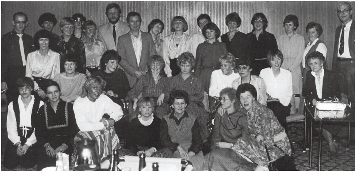
Personalet samlet til julefrokost ca. 1970.

Vi gjorde meget ud af at uddanne vores personale. Vi holdt morgenmøder og aftenmøder med jævne mellemrum og forsøgte i det hele taget at skabe en god ånd i firmaet. Jeg tror, at det lykkedes. Selv nu 23 år efter at vi lukkede forretningen, holder en lille gruppe af "gamle piger" stadig sammen og benytter enhver lejlighed til at mødes og mindes de gamle dage.