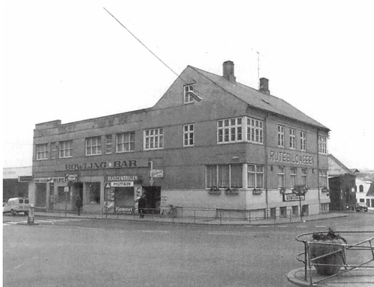
Rutebilcaféen, hvor Kolding Teaterselskab blev opløst. Foto fra 1960erne.

Konsekvensen blev, at man indkaldte til en ekstraordinær generalforsamling den 4. december 1945 på Rutebilcaféen. Det eneste punkt var foreningens opløsning, da man ikke havde råd til at anke sagen, ikke havde flere penge i kassen, og man heller ikke havde råd til at betale forlystelsesafgiften fremover. Forslaget om nedlæggelse af Kolding Teatersel-