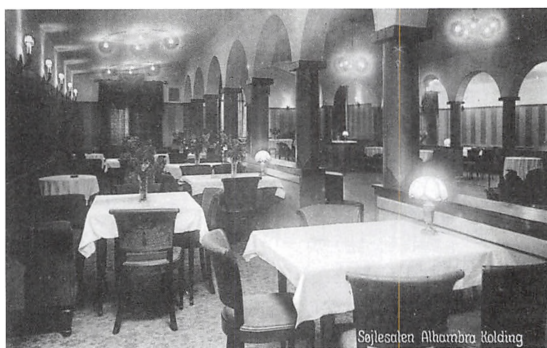
Alhambra, der var blevet opført ved Stejlbjergan-lægget i 1882 som "Pavillon med Restauration".