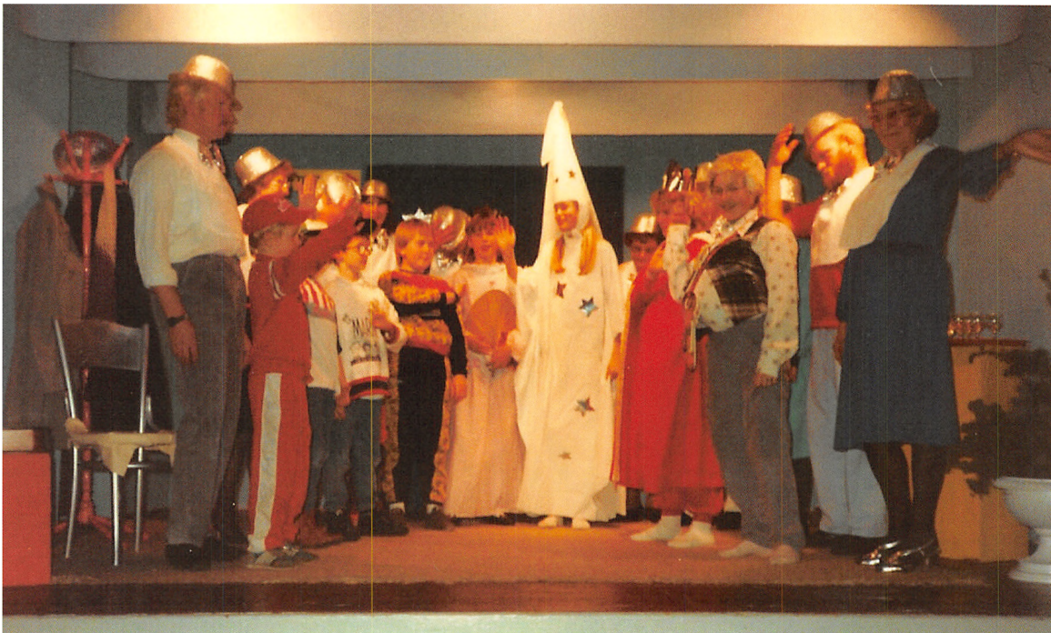
Børne- og Ungdomsafdelingen optræder i forestillingen "Panodrama" (1989).