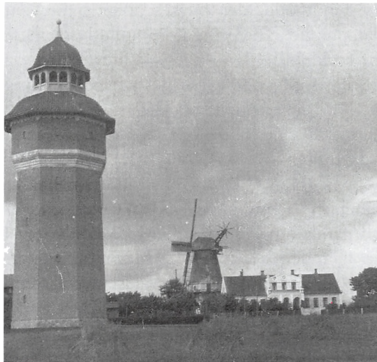
Vandtårnet med Gøhlmanns Mølle i baggrunden, ca. 1920.

Området Ryttermarksvej/Overmarksvej domineres af fine kommunale bolighuse ”Udsigten”, som blev bygget i perioden 1919-1923. I 1916-17 byggedes Vandtårnet på Gøhlmannsvej, der var nødvendigt for at sikre vand til de