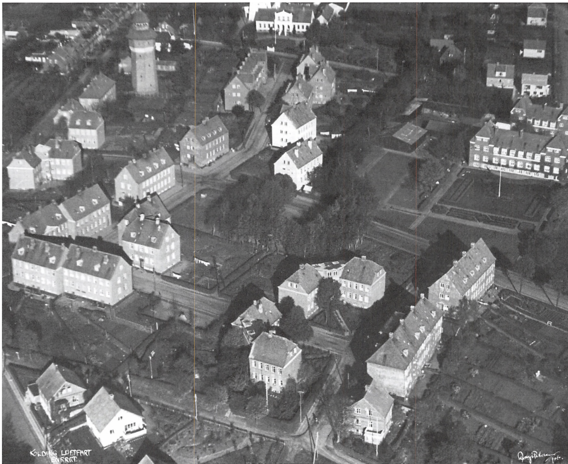
Boligområdet Udsigten ca. 1948. Øverst Vandtårnet og Møllegården. Til højre Overmarksgården.

En anden stor fornøjelse var, at man i sommertiden tog ud til Harte Kanal for at bade,