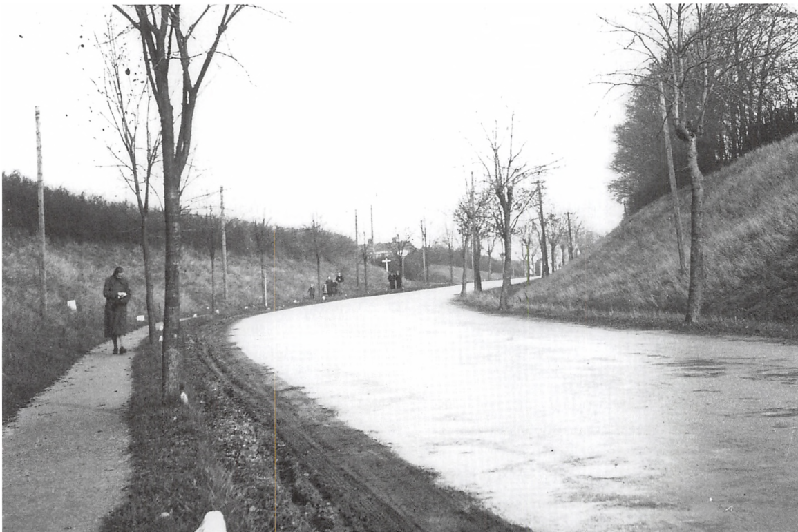
Vejlevej, ca. 1940. Det er stykket mellem Kastaniealle og Galgebjergvej, der kan ses til venstre.

glatte veje skulle gruses. Da der ikke dengang var ret mange, der havde telefon, måtte vej-assistenten i bil køre rundt og indkalde det personale, der skulle deltage i grusningen. Grusningen foregik stående på ladet af last-bilen, og gruset blev kastet med skovl. Det var før grusspredernes tid. Min far var ansat ved det kommunale vejvæsen.