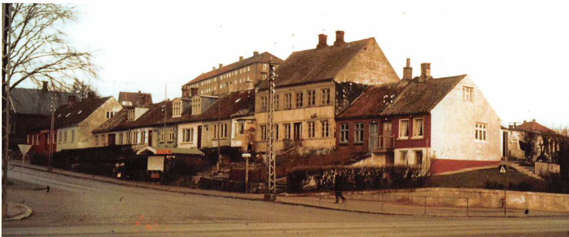
De faldefærdige huse på Gøhlmannsvej, der blev erstattet af Nordre Kollegium.