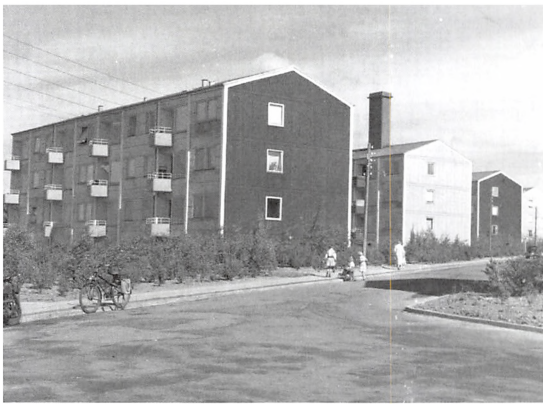
Rosenhaven, 1958.

I 1961 blev der truffet beslutning om at bygge et ungdomskollegium i Kolding. De omtalte ejendomme fra Gøhlmannsvej til Sneppevej blev erklæret for saneringsmodne og opkøbt af kommunen. Kollegiet blev opført i et samarbejde mellem Arbejdernes Andelsboligforening, Samfundet for Vanføre og Kolding Kommune. En del af kollegiets værelser blev i mange år udlejet til Teknisk Skole, der her indlogerede kostskoleelever fra hele landet. Nu er kollegieværelserne ændret til ungdomsboliger.