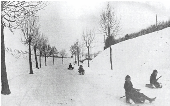
Kælkning ned ad Vejlevej i 1930'erne.

ligere havde sin Volvo-autoforretning, og hvor der nu er åbnet et Lidl supermarked.