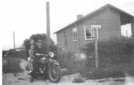
Solsortevej 22 i Haveselskabet Nørrevang. Til venstre kolonihavehuset omkring 1950, til højre det nybyggede murstenshus o. 1955.