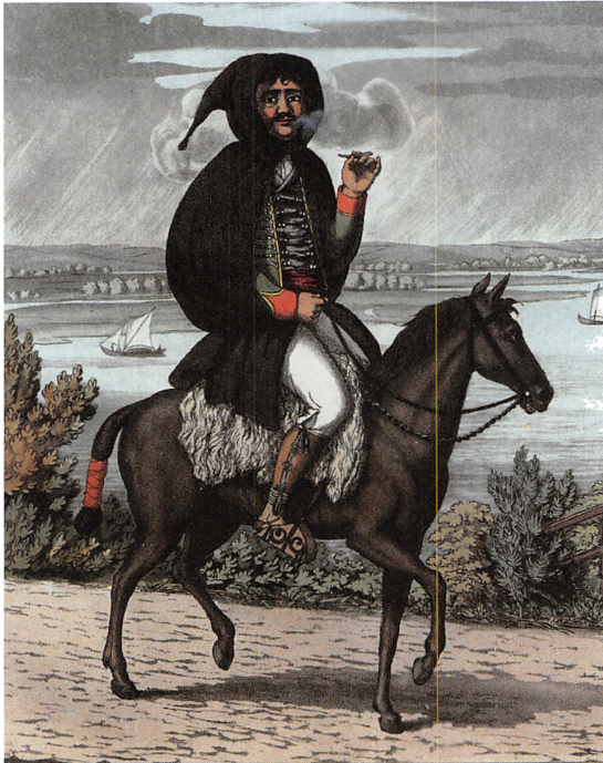
Menig soldat fra det spanske rytteriregiment Princesa med sin uundværlige cigaret.

Da Koldings borgere fik mod til at se dem nærmere an, var en af de ting, der virkelig adskilte dem fra andre soldater, at de alle fra den øverste general ned til den menige soldat dampede på disse små hvide cigaritos eller papircigarer , som man i starten benævnte cigaretten. Nok var man vant til, at soldater var rygere, men hidtil havde det været på lange piber eller tykke mørke cigarer, der afgav kraftige røgskyer.