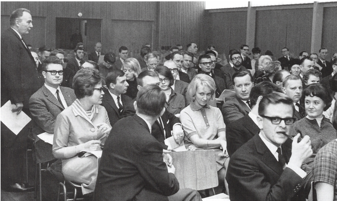
Stiftende generalforsamling i Trekantområdets Universitetsforening, 24. januar 1967. Et talstærkt fremmøde vidner om den lokale opbakning til universitetsplanerne. På generalforsamlingen fire år senere mødte kun rundt et dusin medlemmer frem for at opløse foreningen.