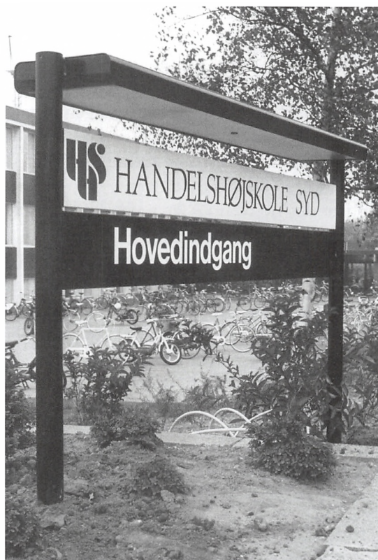
Handelshøjskole Syd på Tvedvej i tilknytning til Kolding Købmandsskole.

Trods lokaleproblemer, interne konflikter mellem afdelingerne i Sønderborg og Kolding samt utallige andre praktiske vanskeligheder viste HHS, at en flercampus-læreanstalt var en praktisk mulighed. Snart kunne Koldingafdelingen ikke længere rummes på Købmandsskolen, og fra 1986 var den delt over lejede lokaler på flere adresser i centrum, blandt andet i "Klostergården" – den nuværende Senior- og Sundhedsforvaltning med et hjørne til det nuværende studentarhus. Først så sent som i 1990 fandt man en bli-