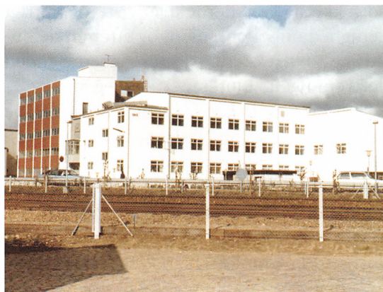
Klostergården, hvor flere lokalradioer holdt til efter 1987.

På et tidspunkt i foråret 1987 forlød det, at Radio Kolding og Apostolsk Kirke ville søge sendetilladelse til lokal tv. Det fik bestyrelsen for Kolding Nærradio "op af stolen". I løbet af kort tid blev den koldingensiske fagbevægelse samlet, og efter en orientering om mulighederne og økonomien var der enighed om at nedsætte et udvalg til oprettelse af et medieselskab med samdrift af både radio og tv. Det LO-støttede selskab AEM Invest kunne være en mulig bidragsyder. Der måtte påregnes udgifter for ca. 3,5 mio. kr. Fra flere mødedeltageres side blev der udtrykt bekymring for økonomien, især på baggrund af Kolding Nærradios gældsforpligtel-