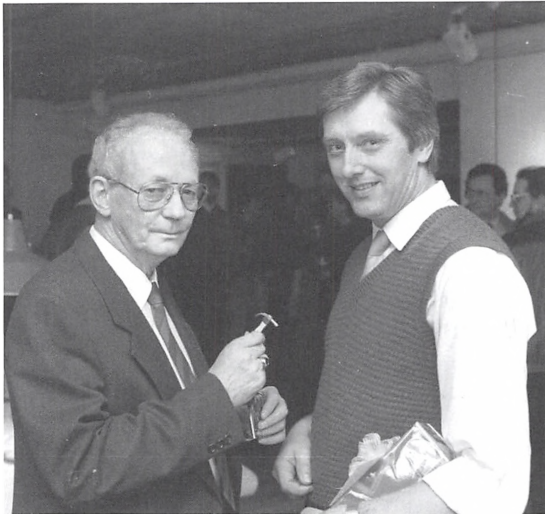
Chefskifte på Kolding Nærradio i marts 1989.

Nærradio. Bevarelse af de frivillige brugeres tilknytning var et ultimativ krav fra Kolding Nærradios side. I drøftelser om frekvensens samlede programudbud deltog også Kanal Kolding ved den nytiltrådte chefredaktør Tage Rasmussen, Kolding Folkeblad.