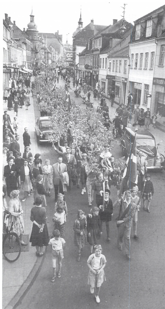
Majfesten i 1956. Optoget går gennem Søndergade på vej tilbage til skolen.