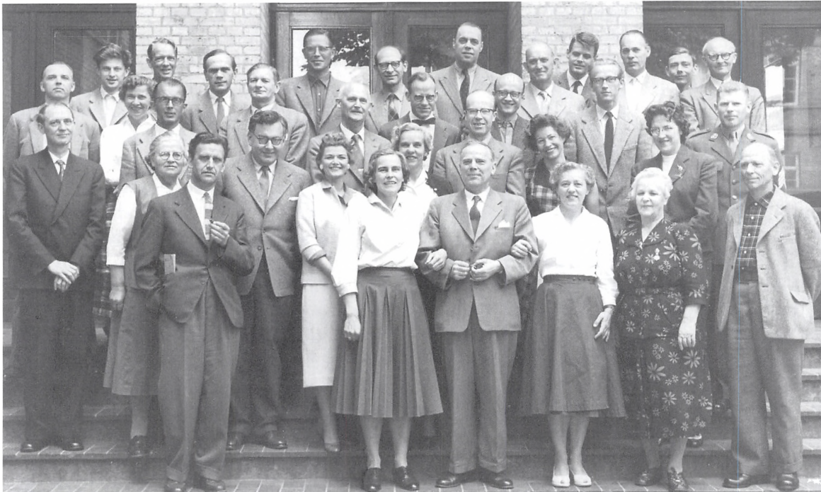
Lærerkollegiet ved Kolding Gymnasium i 1958.