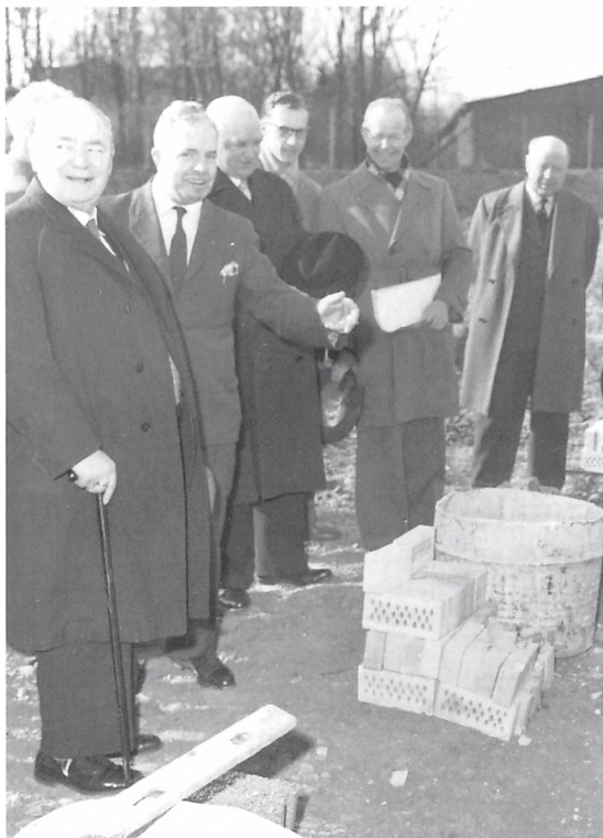
Grundstensnedlæggelsen til Forsvarsbrødrenes Stiftelse, Dyrehavevej 100-106 i april 1960.

Grev Ingolf er æresmedlem af selskabet og deltog sammen med grevinde Sussie i 120 års jubilæumsfesten i 1999, der afholdtes på