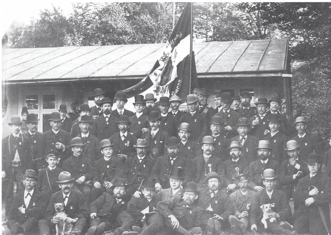
Forsvarsbrødre ca. 1895.

Forsvarsbrødrene oprettede også deres egen sygekasse. Den begyndte sin virksom-