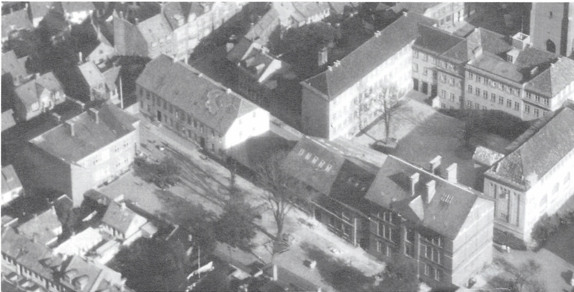
Sct. Nicolai Skole, oktober 1948.

ninger nærmest Katrinegade hen mod Sviertorv. Der var sat et træærkværk op, hvortil vi måtte komme i skolegården, og på den anden side gik tyske soldater vagt. På den side, hvor tyskerne gik vagt, var der også en række toiletter, ligesom i "vores" afdeling. Går vi videre på vores runde rundt i den gamle skole, kommer vi til lokaliteterne i Skolegade. Mellem de bygninger, tyskerne havde besat og den hvide to-etagers bygning med 2 opgange, var der dengang et stort halvtag, hvor vi kunne gå ind, hvis det regnede i frikvartererne, og der var en dør ud til Skolegade. Man behøvede altså ikke gå helt om til hovedindgangen i Blæsbjerggade.