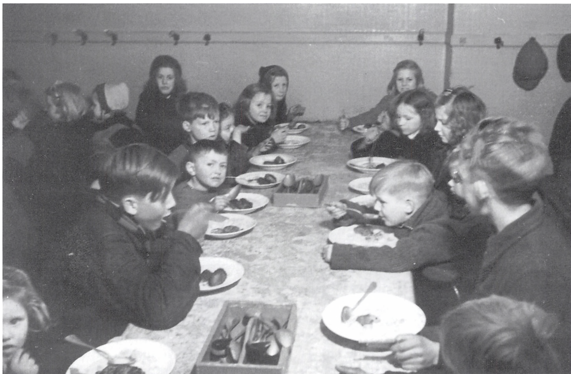
Børnebespisningen, “Samaritanen” i kælderen under midterbygningen i Skolegade, hvor der i dag er Nicolai for Børn. Foto fra 1944.

lebespisningen, hvor mindrebemidlede børn kunne gå ned i det store spisefrikvarter og få et måltid varm mad. Én gang om året var det frikadedag, og det så man virkelig hen til. Det var et måltid, som blev sponsoreret af en af Koldings velstillede borgere – jeg husker ikke hvem. Det var ikke “fint” at spise på Samaritanen, så derfor var det kun de fattigste af børnene, der gik derned, for dengang var der virkelig fattige børn til. Mange kom fra Havneboligerne, som lå tæt ved havnen, og hvor der mange steder blev drukket lidt rigeligt. Det var også børn derfra,