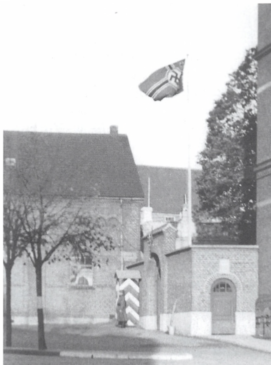
Det nazistiske flag ved indgangen til skolegården ved Pigeskolen. I baggrunden gymnastikbygningen, i dag Nicolai Scene.

Træerne blev der aldrig klatret i – jeg mener også, at de allerede dengang var for høje til, at det kunne praktiseres. Hvad drengene lavede i frikvarteret, ved jeg ikke. Men vi piger både hinkede og hoppede i sjippetov. Tit hoppede vi i langreb, og af og til var vi næsten samtlige piger i skolegården, som var med om det samme reb. Ligeledes, når vi legede sanglege, såsom "I haven der har jeg et pæretræ", "Munken går i enge", "To mand frem for en enke", "Tornerose", "Bro, bro brille" og flere andre. Det blev til en stor kreds, hvor alt foregik i fordragelighed. Vi byttede også påklædningsdukker, servietter