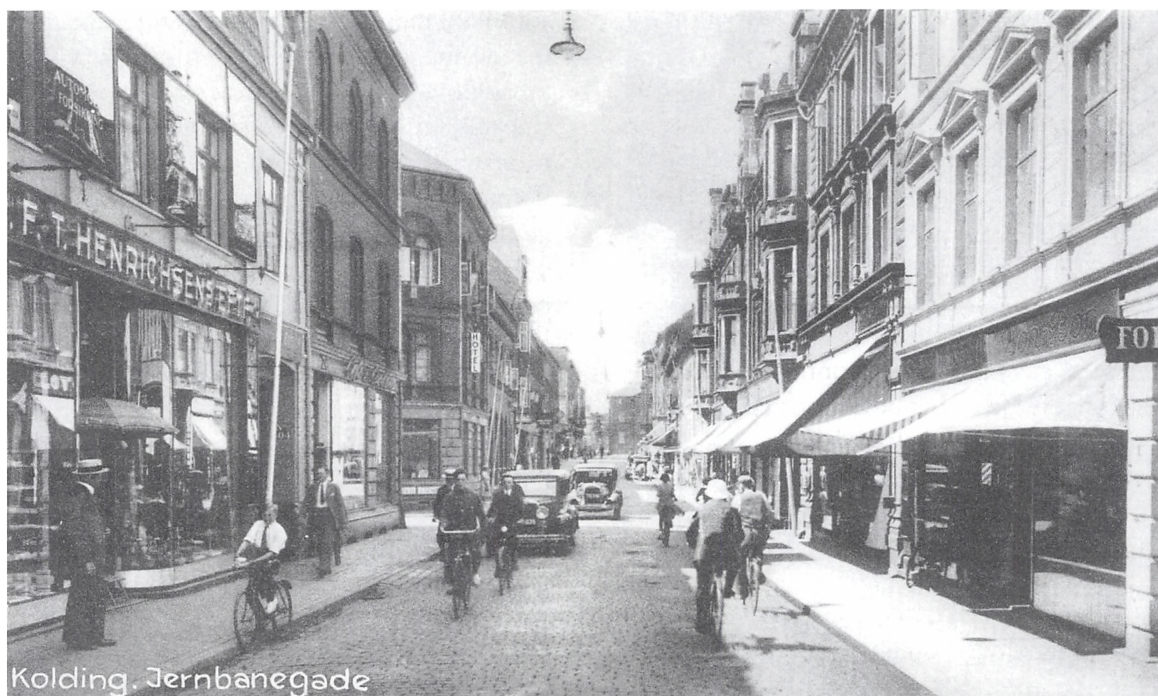
Den smalle del af Jernbanegade, som den så ud i slutningen af 1930'erne. Til venstre med skiltet Hotel ses Højskolehjemmet.