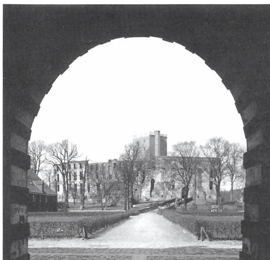
Koldinghus fra Staldgårdsporten ca. 1960.

Men vort foretrukne sted var byens grønne oase, Koldinghus Slotshave med Staldgården og Slotssøen – her var fred og alligevel tilpas vildt til os. Her var flere niveauer i stisystemerne, og med ruinen som midtpunkt