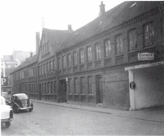
Gråbrødregade med indgangen til gården. Foto ca. 1960.