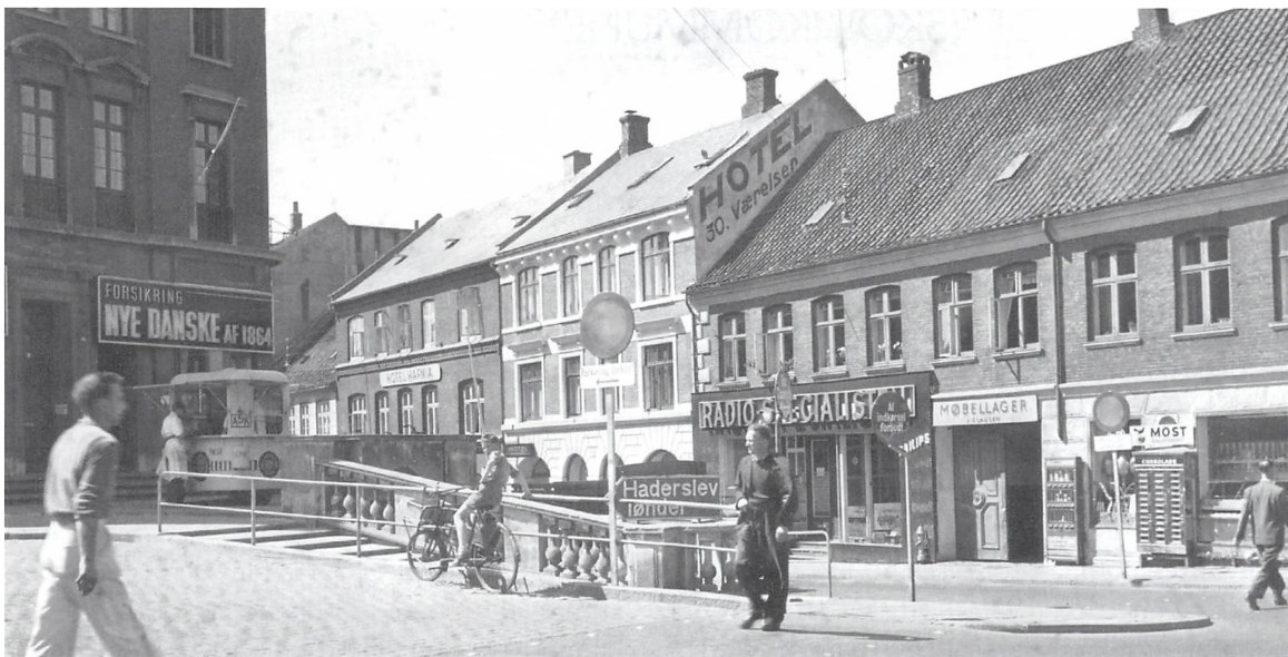
Munkegade/Buen ca. 1955.